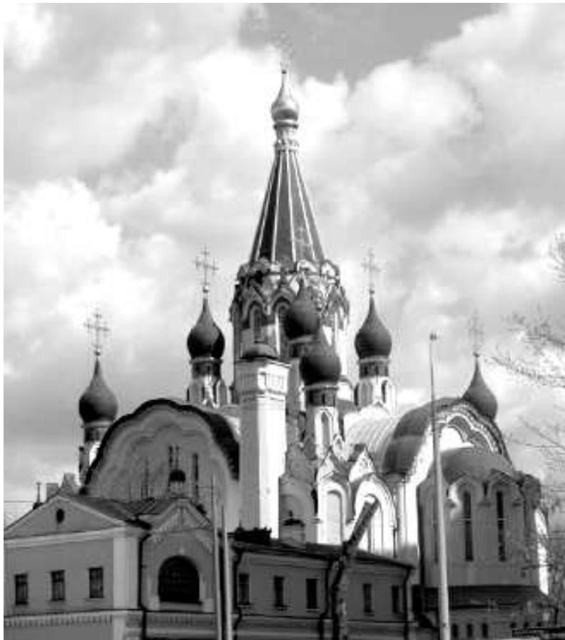
Храм Воскресения Христова в Сокольниках

одной из самых чтимых святынь, Матушкой-Заступницей москвичей. Через Воскресенские ворота въезжали на Красную площадь победители; цари и царицы, прибыв в старую столицу, первым делом отправлялись поклониться Иверской как и все, кто приезжал в город. Москвичи шли в часовню помолиться о всякой насущной