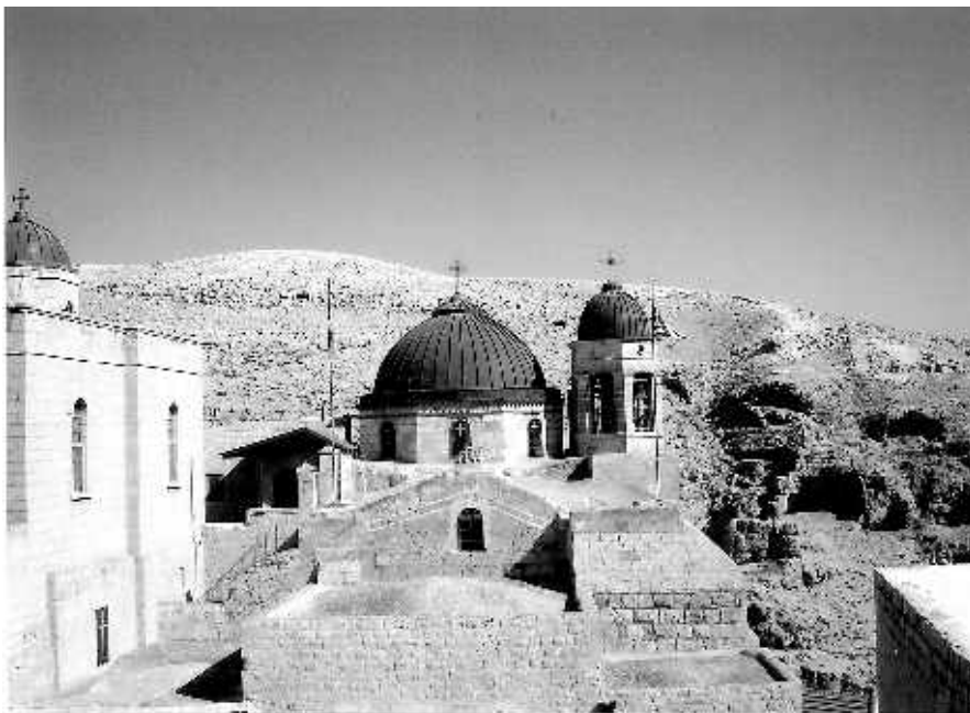
Лавра прп. Саввы Освященного в Иудейской пустыне

В 1898 г. община получила статус ставропигиального монастыря, названного «Горненским». Монашеская жизнь здесь не прерывалась ни на один год. В 1987 г. в Горнем появился новый пещерный храм Предтечи и Крестителя Господня Иоанна на месте дома праведных Захария и Елисаветы. В настоящее время в Горненской обители живут и несут послушания около 60 сестер, игуменья монастыря