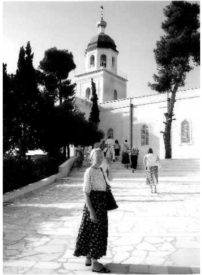
Монастырь Пресвятой Троицы