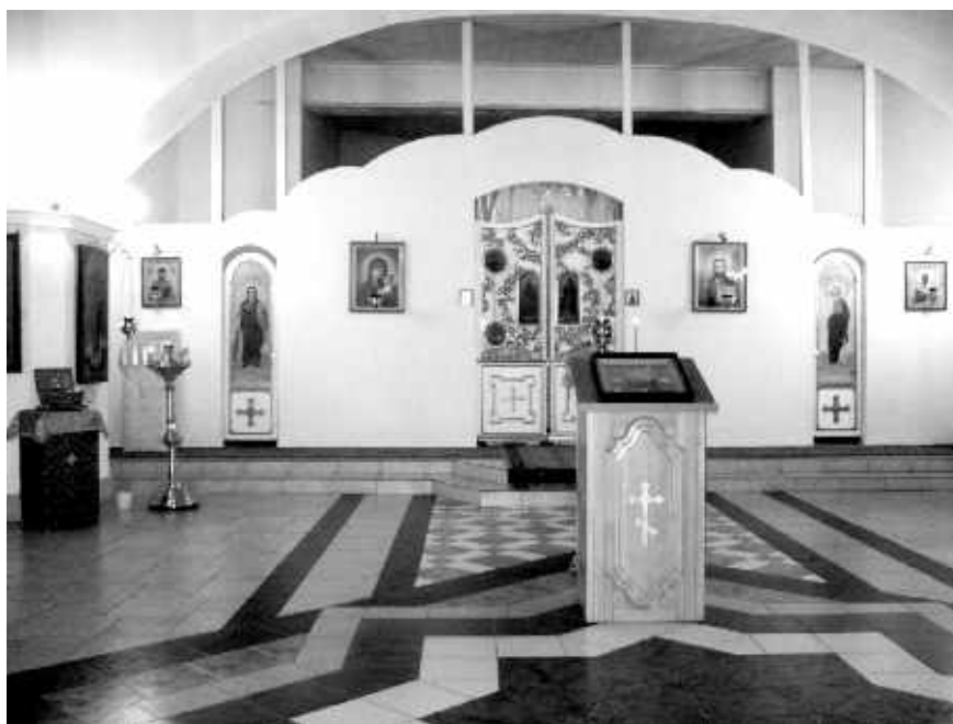
Храм свт. Николая, г. Искитим