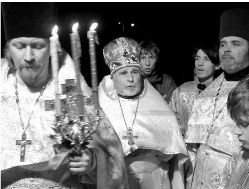
Храм свт. Николая у Соломенной сторожки. Пасха. 2009 год