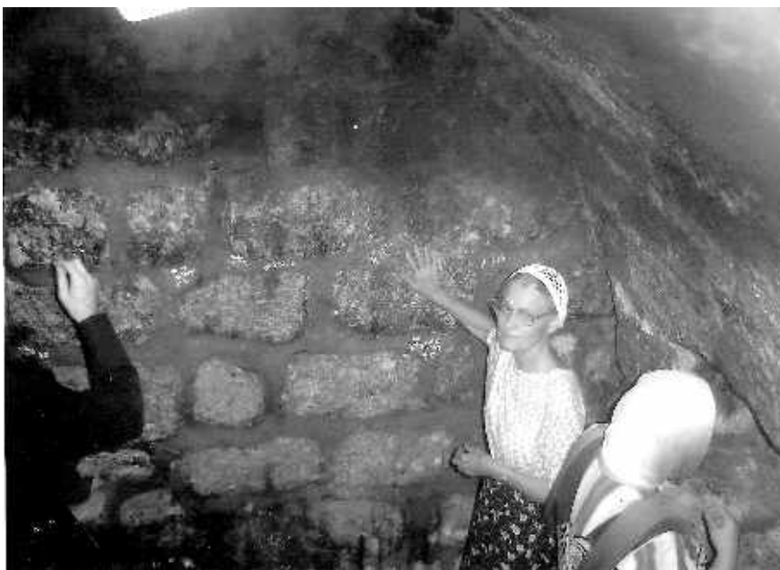
Пещера погребения Лазаря

В Вифлеем попадаем в предпоследний день. Гостиница «Santa Maria». Базилика Рождества Христова. В IV веке св. равноапостольная Елена построила над