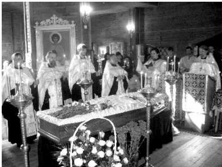
Отпевание отца Владимира

Мои дети, да и все мы любили батюшку. Было трудное время. Он всегда, когда они подходили ко кресту, давал им то конфетку, то шоколад, то печенье – для них радость.