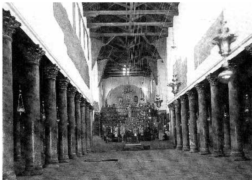
Базилика Рождества Христова

На обратном пути посетили храм свт. Николая над пещерой, в которой он подвизался в течение двух лет. Приложились к иконе с частицей его мощей.