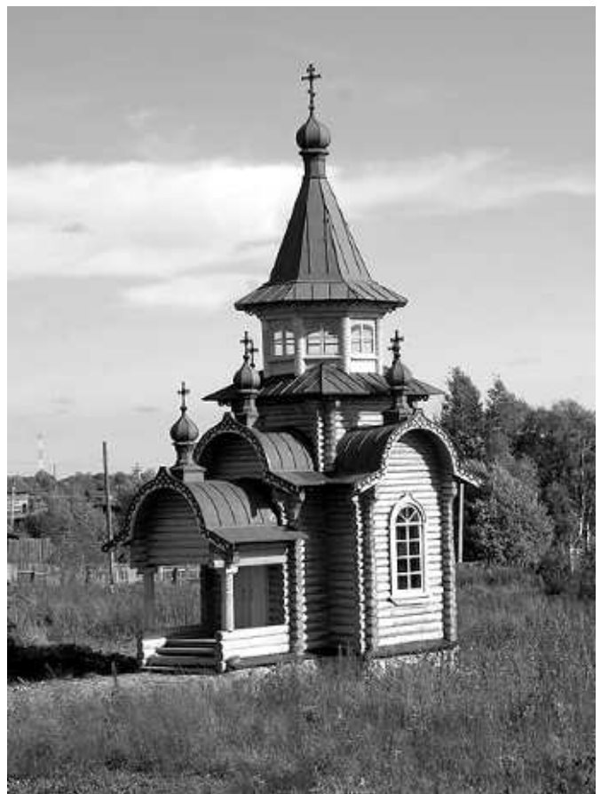
Часовня новомучеников кирилловских

На другой день с утра, не торопясь, с экскурсией осмотрели Ферапонтово. Это не очень