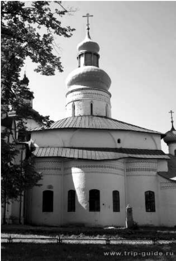
Успенский собор Кирилло-Белозерского монастыря

ными надписями людей, почитавших за честь положить плиту на территорию монастыря под ноги благочестивым монахам.