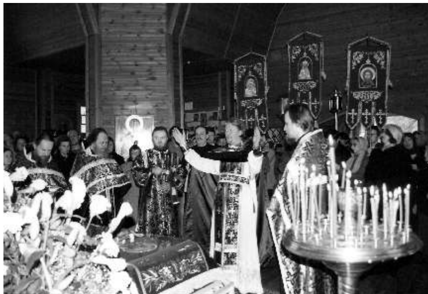
Утренняя Великой Субботы

Совершается Литургия св. Василия Великого и соединяется с