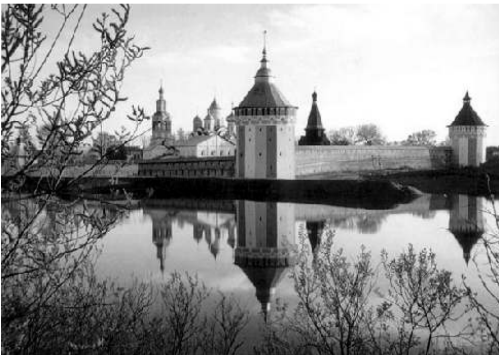
Спасо-Прилуцкий Димитриев мужской монастырь

Вологда – большой, суетливый, похожий на Москву город, но при этом еще сохранивший неповторимое своеобразие деревянных резных домов и память о своих былых независимости и величии. Так и стоят перед глазами бесчисленные церкви и монастыри Вологодчины, непременно с серыми, из оцинкованного железа крышами – шлемами и луковками. Серыми, везде одинаковыми, строгими и угрюмыми; лишь кое-где встречаются медные, совершенно черные от времени, с золотыми звездами.