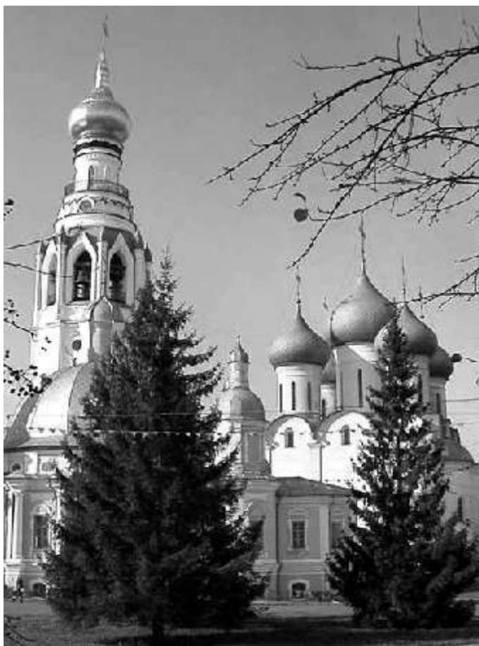
Колокольня, Воскресенский и Софийский соборы Вологодского кремля

В самой Вологде есть белокаменный Кремль, выросший из крупного, укрепленного монастыря и называемый Архимандритовым подворьем. Возле Кремля три церкви в разном стиле: главный в городе Софийский собор, церковь Воскресения и церковь Александра Невского и высокая колокольня. А в остальном как везде: здесь же на площади гуляют, торгуют сувенирами –