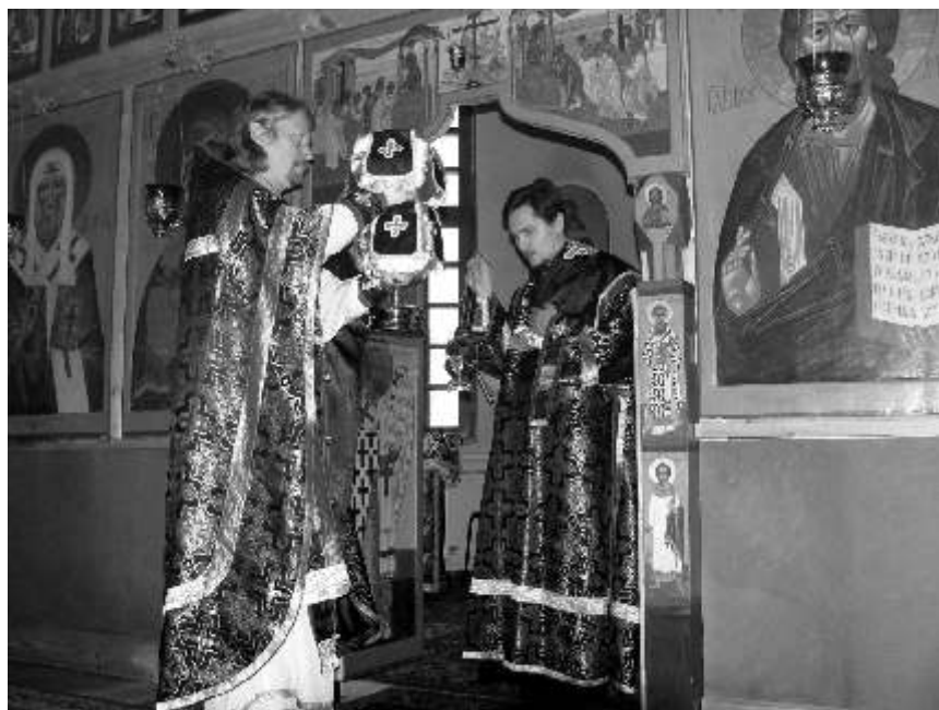
Литургия Преждеосвященных Даров

В Великий Понедельник Церковь в своих песнопениях приглашает встретить начало Страстей Христовых. В богослужении Понедельника воспоминается ветхозаветный патриарх Иосиф Прекрасный, из зависти проданный братьями в Египет, прообразовавший страдания Спасителя. Кроме того, в этот день воспоминается иссушение Господом покрытой богатой листвою, но бесплодной смоковницы, служащей образом лицемерных книжников и фарисеев, у которых, несмотря на их внешнюю набожность, Господь не нашел добрых плодов веры и благочестия, а только лицемерную тень закона. Подобна бесплодной, засохшей смоковнице всякая душа, не приносящая плодов духовных, —