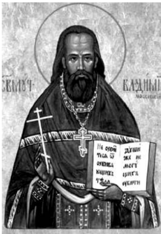
Священномученик Владимир Амбарцумов

Теперь о другом. Всегда ли ты молишься и запоминаешь ли какие-нибудь новые молитвы? Есть ли такие, которые находят отзвук в душе? Молись и о людях близких, и о своих всех делах и мечтах.