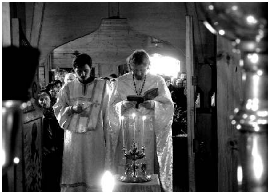
Благословение хлебов и вина в Великую Субботу

После этого верующие благоговейно ожидают наступления полуночи, в которую начинается светлая Пасхальная радость величайшего праздника Воскресения Господа и Спасителя нашего Иисуса Христа.