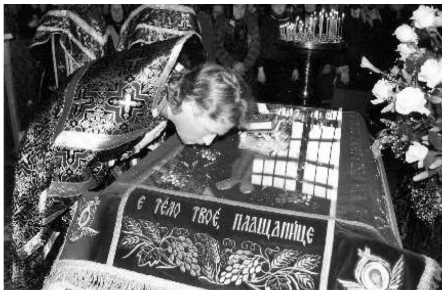
Поклонение перед Плащаницей в Великую Пятницу

На вечерне, при пении тропаря « Благообразный Иосиф с древа снем пречистое Тело Твое... » священнослужители поднимают Плащаницу (изображение Христа, лежащего во Гробе) с престола, как бы с Голгофы, и выносят ее из алтаря на середину храма. Затем священнослужители и все молящиеся