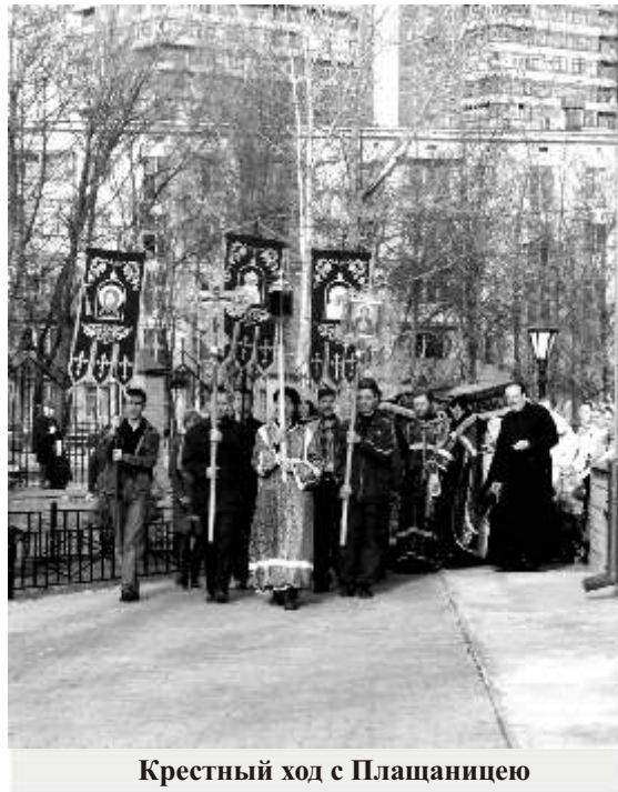
Крестный ход с Плащаницею

Затем Литургия св. Василия Великого продолжается обычным порядком. Вместо Херувимской песни поется песнь: « Да молчит всяка плоть человека... » Великий вход совершается около Плащаницы. Вместо «Достойно есть» поется: « Не рыдай Мене, Мати, зрящи во гробе... », запричастный стих: « Воста, яко спя Господь, и