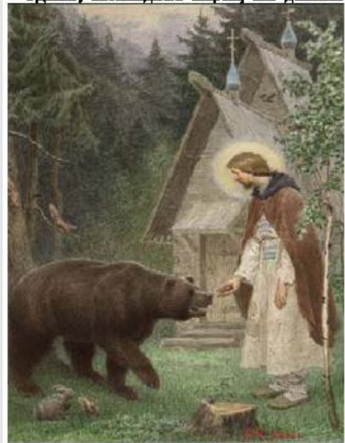
Икон. Сергий Радонежский и медведь