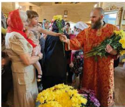
Поздравление в день жён-мироносиц