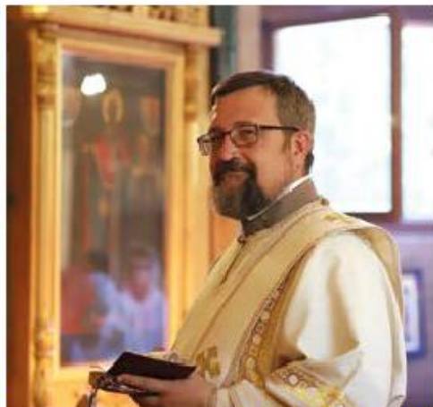
Доброта славет мир!