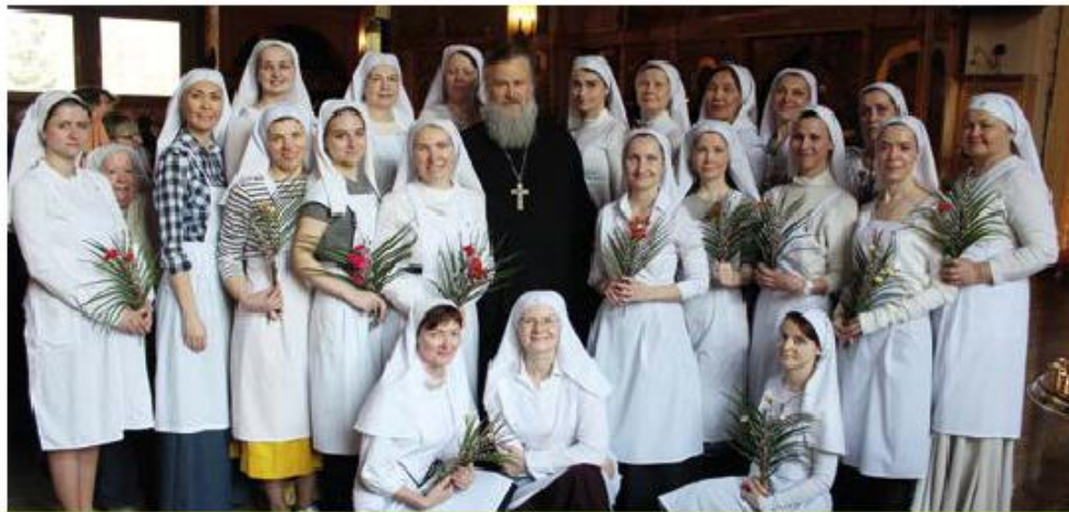
Общее фото на Вербное воскресенье