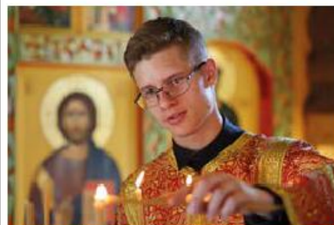
«Помози, Господи, сдать экзамен!»