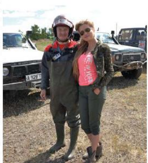
На соревнованиях по автогонкам

И: – Я долго работаю в кино с режиссером Тимуром Бекмамбетовым, около 11 лет. Часто ездили в командировки, подруга не была в Казахстане. Тут меня Тимур отправляет по фильму «Вики» по России и в Казахстан, я