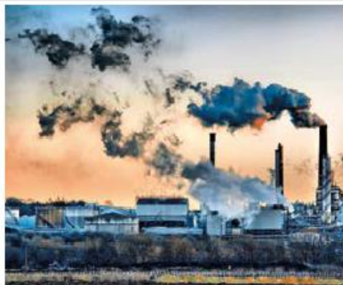
Завод, который человек наносит природе

являть предельное смирение и осмотрительность. Бог дал нам «господство» над животными (Быт. 1:28), но господство вовсе не означает тиранию.