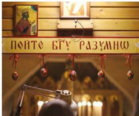
Новая роспись камреси