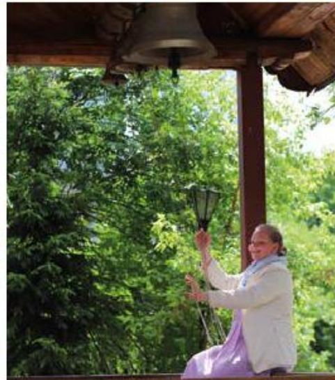
Звон колоколов – музыка небес