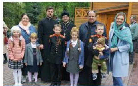
Наша приходская семья