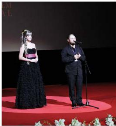
Открытие кинофестиваля в Астане