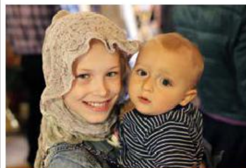
Счастливы те, кто на престоде растёт!