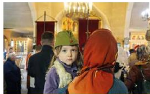
«Спасибо деду за победу!»