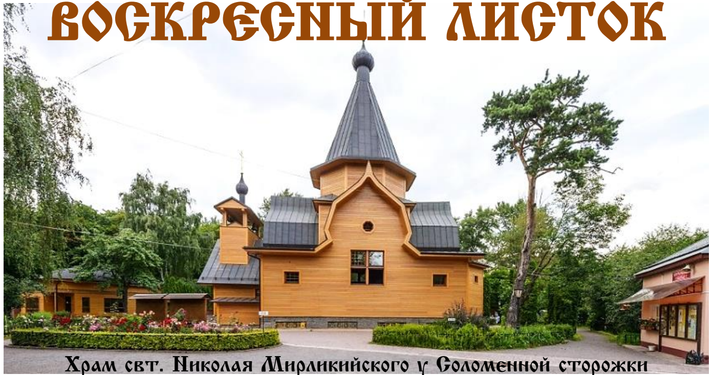
Храм свт. Николая Мирликийского у Голоменной сторожки