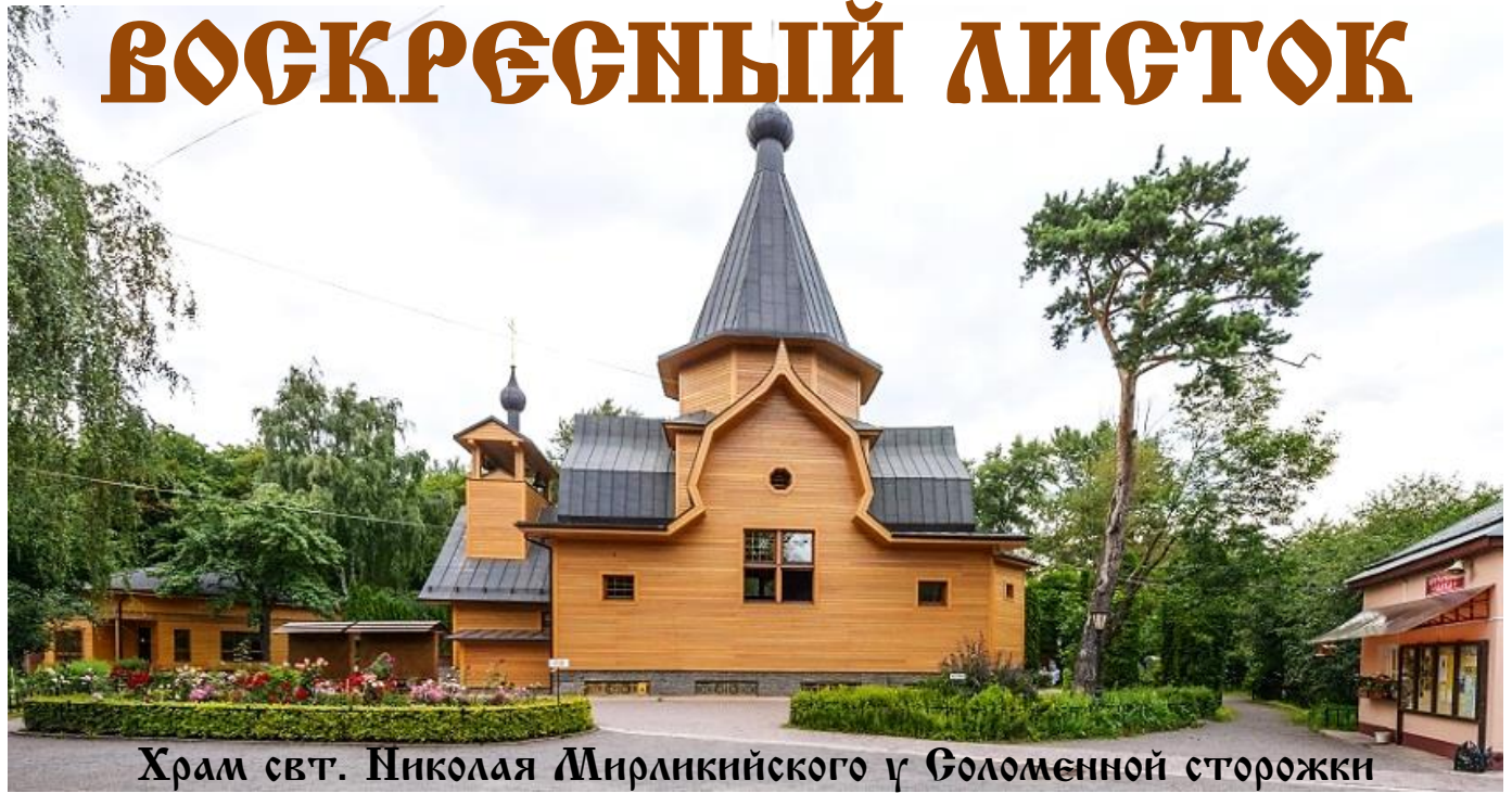
Храм свт. Николая Мирликийского у Голоменной сторожки