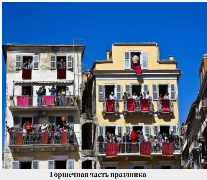
Горшечная часть праздника

Надо признать, что, машинный парк на Корфу вызывает уважение – машины в основном малень-