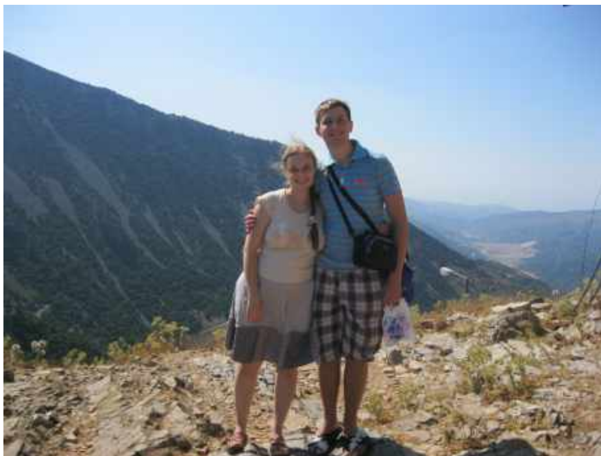
Свадебное путешествие. Крит