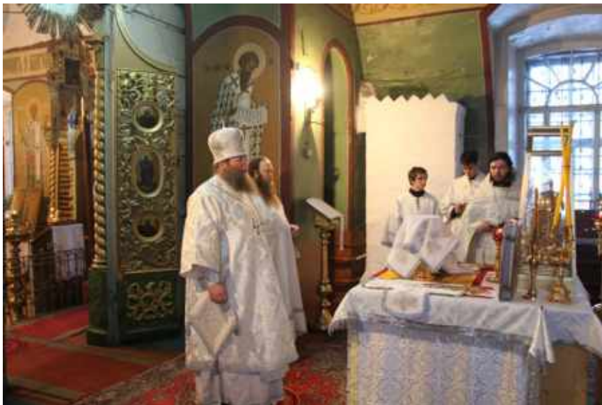
Посещение Свято-Троицкого храма епископом Муромским Нилом

В 1882 г. в Горках открылось земское начальное народное училище. Обязанности законоучителя там выполняли священники местной Троицкой церкви. Первоначально число учеников колебалось около 60, а к 1915 г. увеличилось до 74 человек.