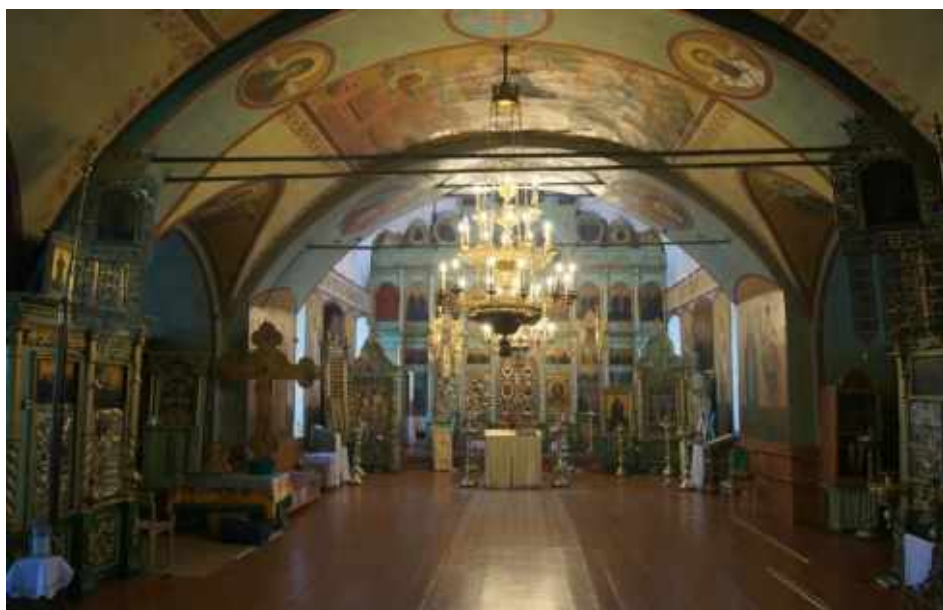
Внутреннее убранство Свято-Троицкого храма

Предки его выехали на Русь из Греции в 1472 г. и занимали видное положение при великокняжеском