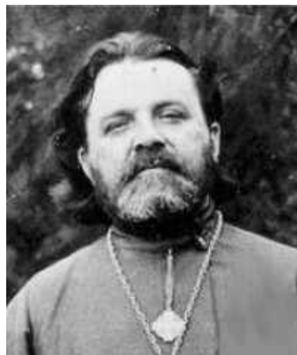
Священник Иоанн Артоболевский

В 1916–1917 годах он читал лекции по богословию студентам Рижского политехнического института,