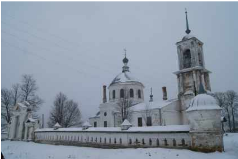
Свято-Троицкий храм, с. Горки

пару лет после свадьбы мы начали строить дом для постоянного проживания. Строили восемь лет... И где-то ближе к концу этого процесса я захотел стать священником. Желание уехать из Москвы и жить под Владимиром осталось, я решил служить Матери Церкви и Богу там и поступил во Владимирскую семинарию.