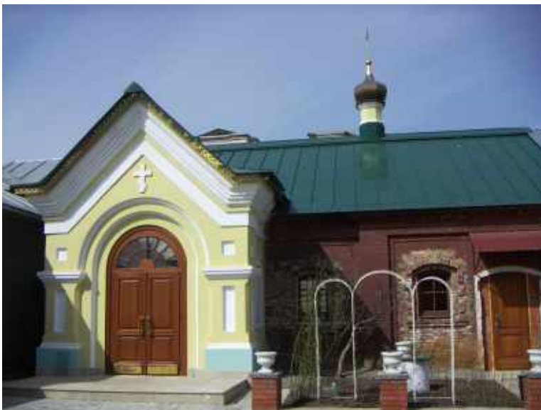
Домовый храм свщмч. Иоанна в настоящее время

«Жития новомучеников и исповедников Российских XX века, составленные игуменом Дамаскиным (Орловским). Февраль». Тверь. 2005. С. 65–71.