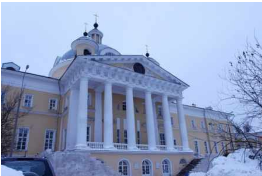
Свято-Димитриевское училище сестёр милосердия

– Значит, этот опыт не отбил желания рожать своих детей. У соседки муж, присутствовавший на родах, упал в обморок. Видимо, в медицину идут люди с крепкой психикой, которые готовы ко всему.