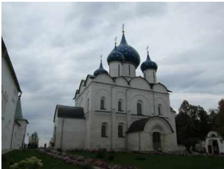
Рождественский собор Суздальского кремля