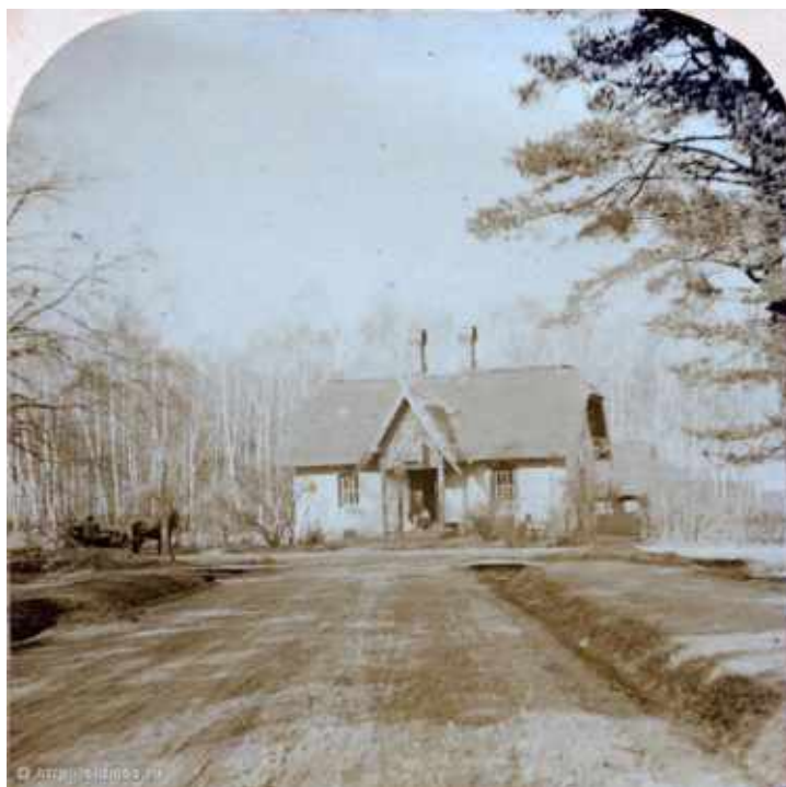
Соломенная сторожка. 1869 г.

Название «Дубки» парку и улице было дано не более полувека назад, по укоренившемуся прозвищу этого места. Есть парки с таким же названием в городах Самаре и Нижнем Новгороде, Петербурге, в Химках. Парк прозвали по молодым дубкам уже после Великой Отечественной войны. Вновь проложенную вдоль западной стороны парка улицу наименовали в 1967 году. До середины XIX века Дубки – небольшая роща, была отделена от леса имения