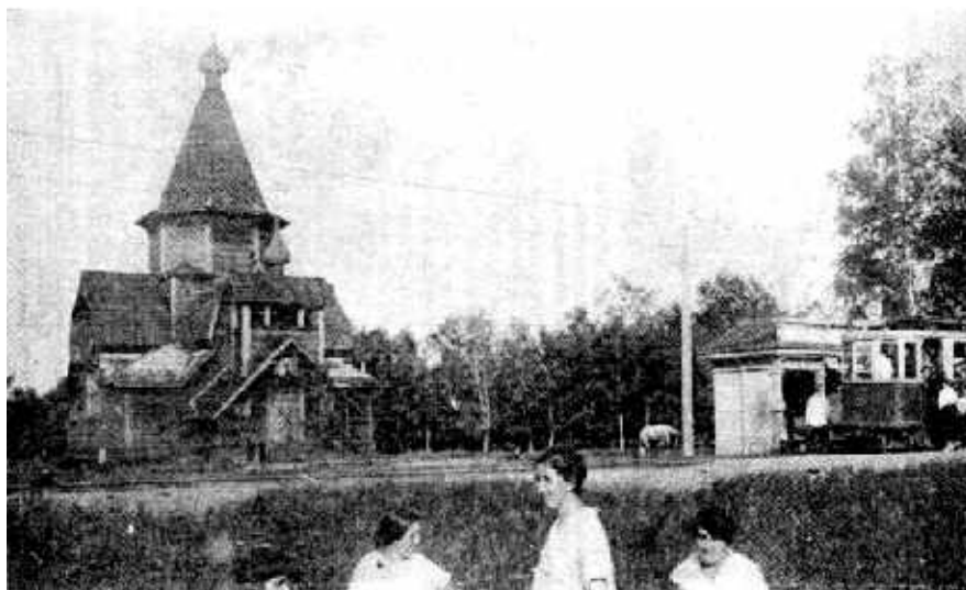
Трамвайная остановка «Соломенная сторожка». Начало XX в.

Им были распланированы аллеи и дорожки (посыпанные гравием), устроены детские площадки. Сазонов очистил и прекрасно спланировал пруды, «разбросал» изумрудно-зелёные лужайки, засеянные густой травой. Большое количество кустарника, посаженного густой живой изгородью вдоль всех дорожек, а на газонах – части малыми и боль-