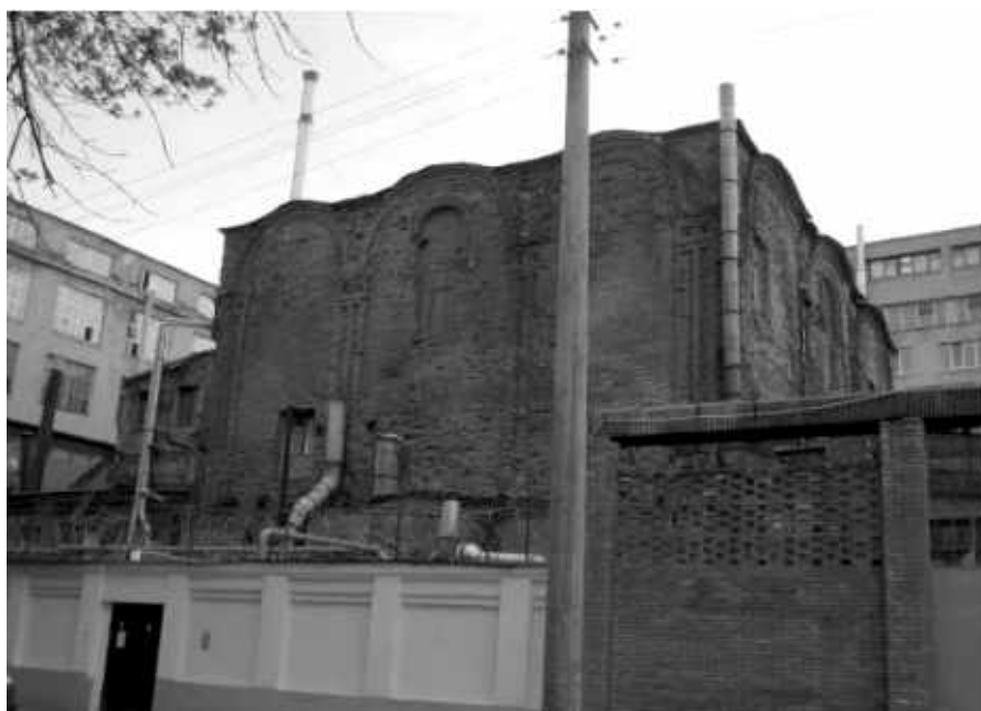
Современный вид храма Рождества Богородицы в Бутырской слободе. Вид с Большой Новодмитровской улицы

В настоящее время ведутся противоаварийные работы по сохранению переданной части храма и колокольни от разруше- ния. Продолжается и тяжба церкви с заводом «Знамя» о пере- даче оставшихся храмовых площадей и территорий. Всё же, самое главное, Божественная литургия, по милости Божией, совершается в двух местах. К колокольне пристроена алтарная часть и совершено освящение св. престола в честь блгв. князя Димитрия Донского, а в самом храме освящён престол в честь Рождества Пресвятой Богоро- дицы. Хочется надеяться, что в ближайшем будущем храм восстановится в былой красе и монументальности и будет вновь восхищать наш московский север.