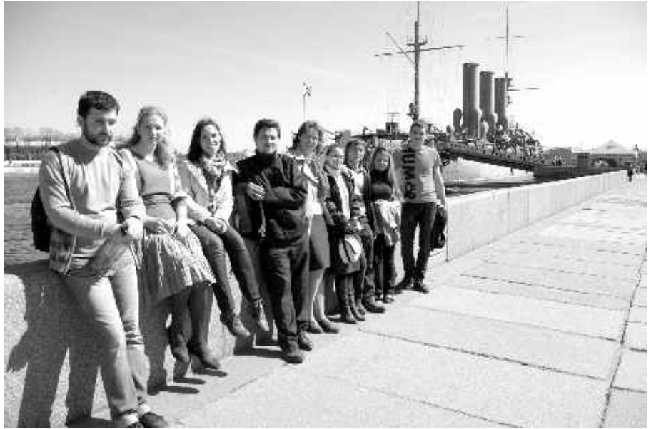
У крейсера «Аврора»

Последний день в Питере предвещал много интересного. Погода продолжала нас радовать и придавала сил к последнему рывку. После Иоанновского монастыря двинулись в Ботанический сад. Достигнув ворот сада, мы увидели довольно большую очередь. Если честно, то для меня это удивительно. Ботсад и очередь для меня просто несовместимые вещи, но от реальности не уйдёшь. Выстояв очередь, заплатили по 40 рублей «с носа» и пошли гулять по территории. Как всегда, прогулка