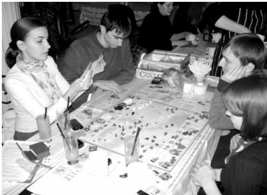
Интеллектуальные настольные игры

Пожалуй, самым ярким событием прошлого декабря была для меня поездка в Саввино-Сторожевский монастырь, что под Звенигородом. О, если бы это была просто поездка в монастырь, а то целое приключение!