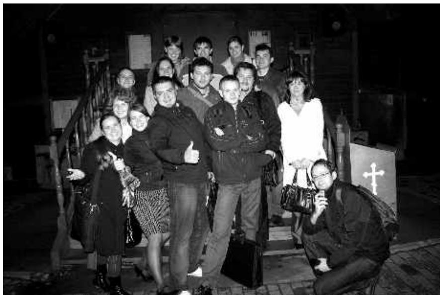
Второй день рождения «Ежечетверга»

Лично для меня жизнь немного поменяла вектор благодаря «Ежечетвергу». Я поняла, кто такие настоящие друзья, смогла найти себе применение. «Ежечетверг» разрешил проблему «одиночества в сети». Теперь есть люди, которых ты всегда рад видеть и переброситься парой словечек, а