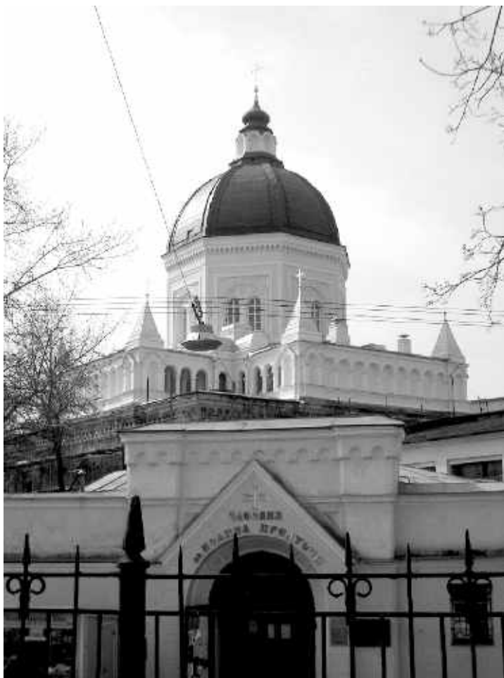
Иоанно-Предтеченский женский монастырь

присоединён медный обруч в окружность головы человека, который легко надевается на голову. На обруче полустёртая, но различимая надпись – краткая молитва ко св. Иоанну Предтече: «Святой великий Предтече и Крестителю Спасов Иоанне,