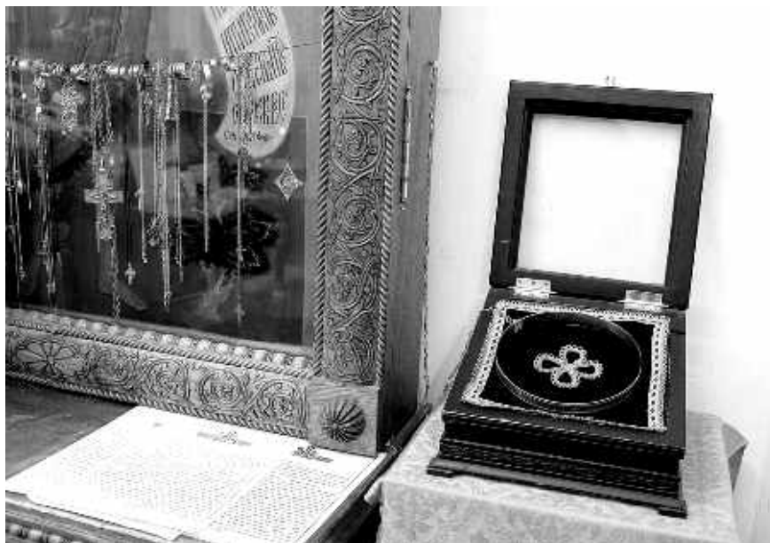
Обруч Иоанна Предтечи

тельствуют о благодатной помощи, которую подаёт Господь по молитвам св. Пророка Иоанна через древний чудотворный образ св. Предтечи с обручем, находящийся в обители. Древняя икона стала апостолом; чудеса и исцеления обращают души людей верующих и неверующих, воцерковлённых и ещё не вошедших под благодатный покров Церкви, к Богу, устремляют к Нему, как Источнику исцелений и всех жизненных сил и