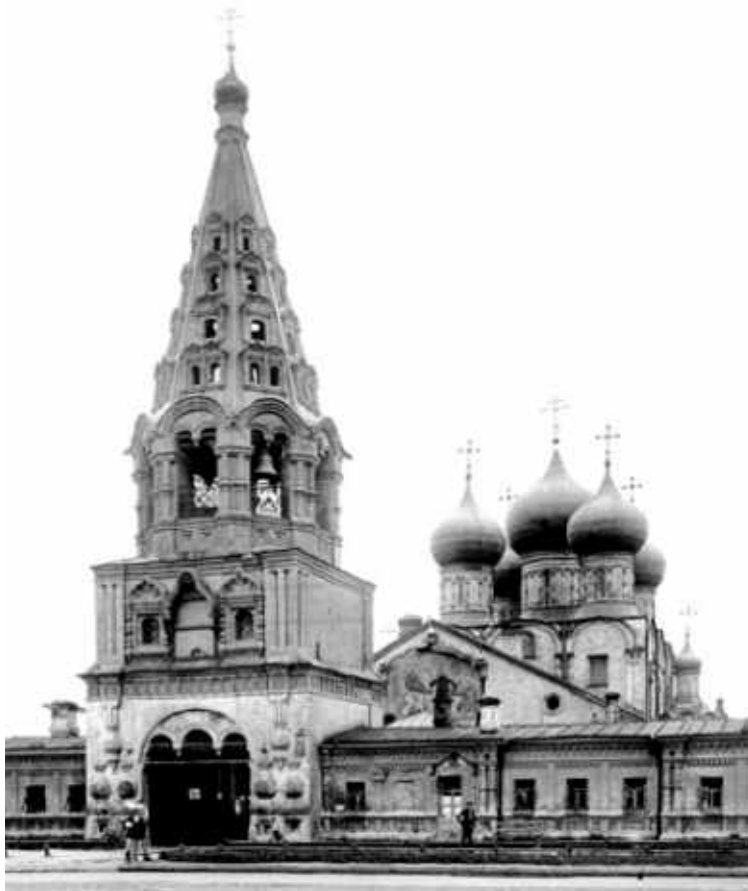
Храм Рождества Пресвятой Богородицы в Бутырской слободе. Вид со стороны Дмитровской дороги. Фото начала XX в.

ской церковью для нашего храма. Текст содержит некоторые грамматические и орфографические исправления с учётом написания слов в настоящее время, при этом сам смысл и содержание переданы без искажения: