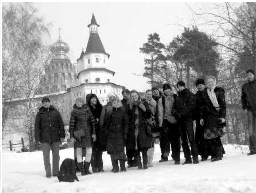
В Новоиерусалимском монастыре

На обратном пути посетили Старицкий монастырь. 3,5 часа всенощной службы пролетели практически незаметно. Храм