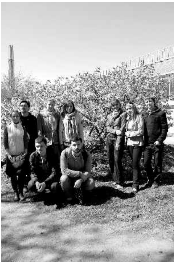
В Ботаническом саду