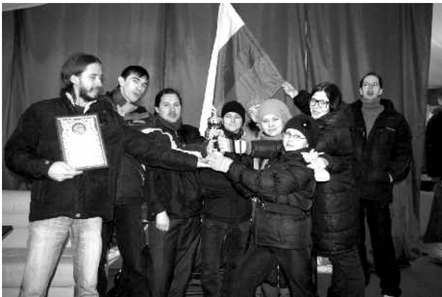
Общемосковский турнир на льду