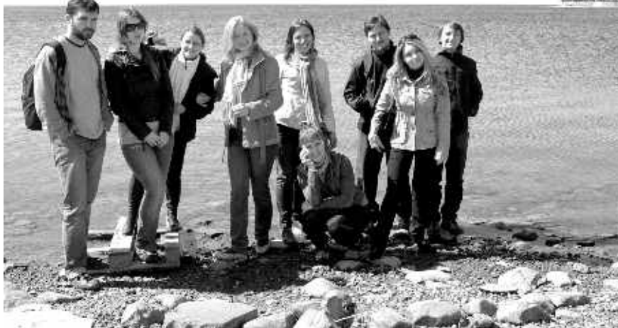
На берегу Финского залива