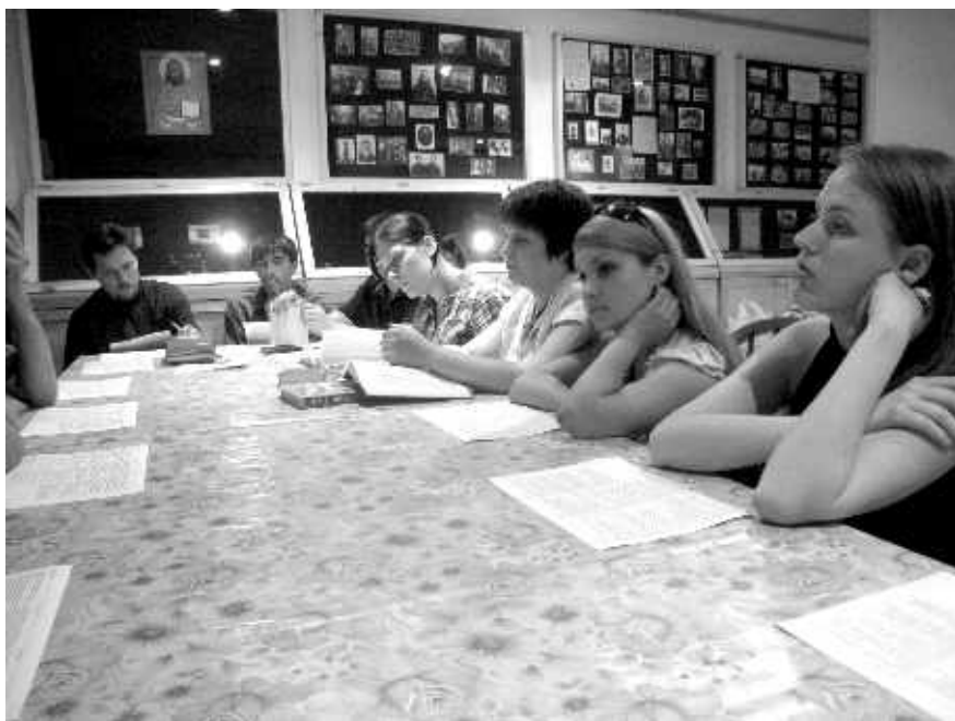
Кружок по изучению Священного Писания

Думаю, что ещё много чего интересного впереди. Так что бросай сидеть дома и приходи к нам на встречи! Может, именно тебя нам и не хватает.