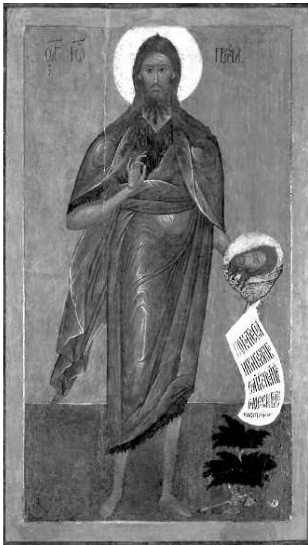
Образ Иоанна Предтечи. Середина XVI века

Другое свидетельство находится в описях 1923 года. В «Списке предметов, не внесённых в общую опись...», от 1 декабря 1923 года значится: «В Часовне: при входе икона Усекно-