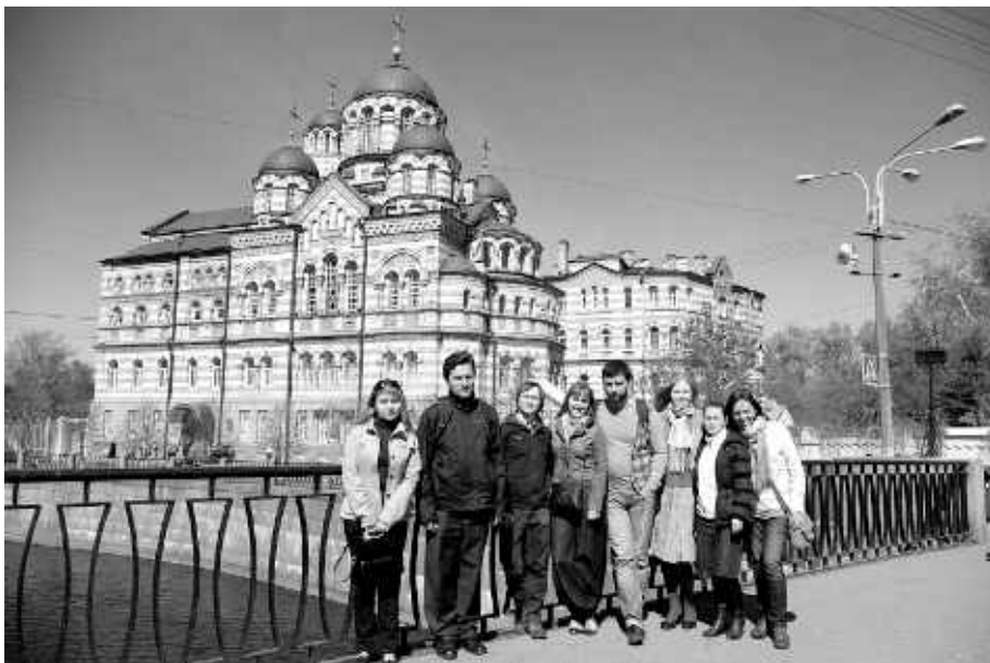
Возле Иоанновского монастыря