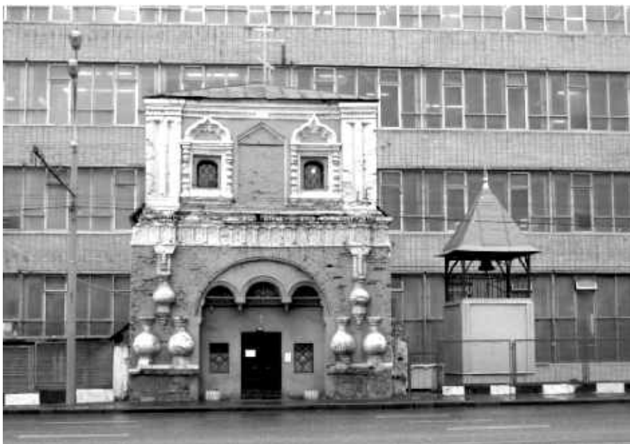
Современный вид храма Рождества Богородицы в Бутырской слободе. Вид с Бутырской улицы

Так когда-то нашему храму была оказана помощь с церковной утварью, а вскоре Бутырский храм-благодетель,