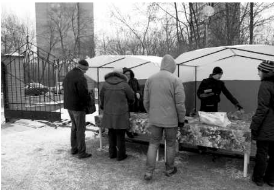
Благотворительный сбор вещей. 28 ноября 2010 года

Я очень рада, что нам всем, и участникам, и жертвователям, была предоставлена такая возможность – сделать хотя бы такое маленькое и незначительное доброе дело. Больше радости я испытывала, не оттого что участвую, а оттого что видела заинтересованных и искренних людей, которые с радостью приходили и приносили то, что у них было, или