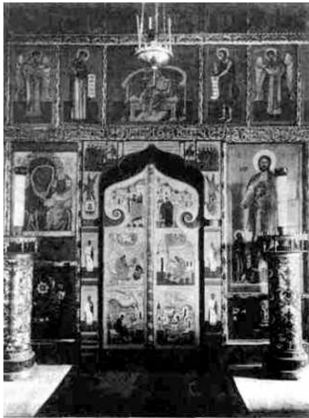
Фрагмент иконостаса. Фото 1916 года.

Через полгода после освящения – в январе 1917 года – в приказах по 675-й Тульской дружине будет объявлено, что «состоящий в