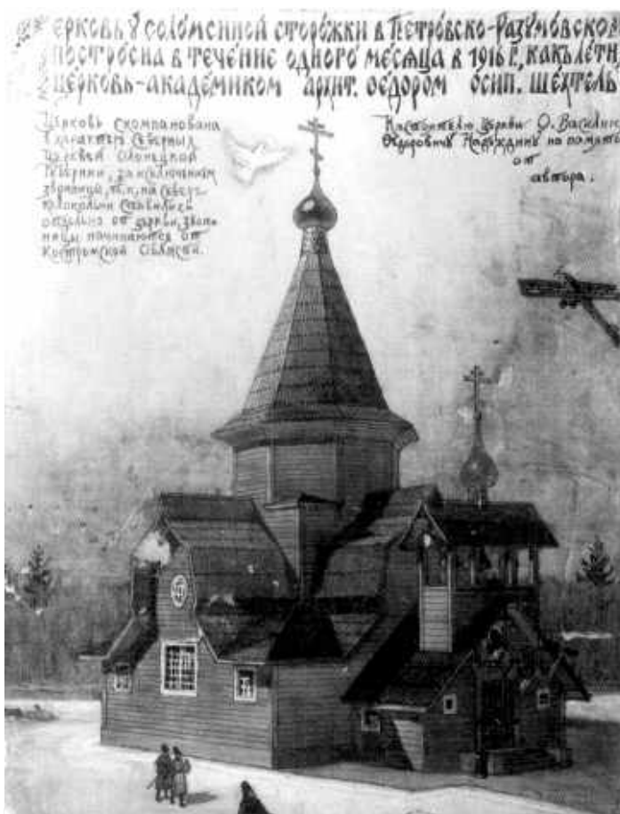
Храм святителя Николая у Соломенной сторожки. Рисунок академика Ф. О. Шехтеля. 1926 г.

Дома Романовых: сестра Императрицы, супруга убиенного террористами Великого Князя Сергея Александровича, Великая Княгиня Елизавета Феодоровна, одетая в форму настоятельницы крестовых сестер милосердия Московской Марфо-Мариинской обители.