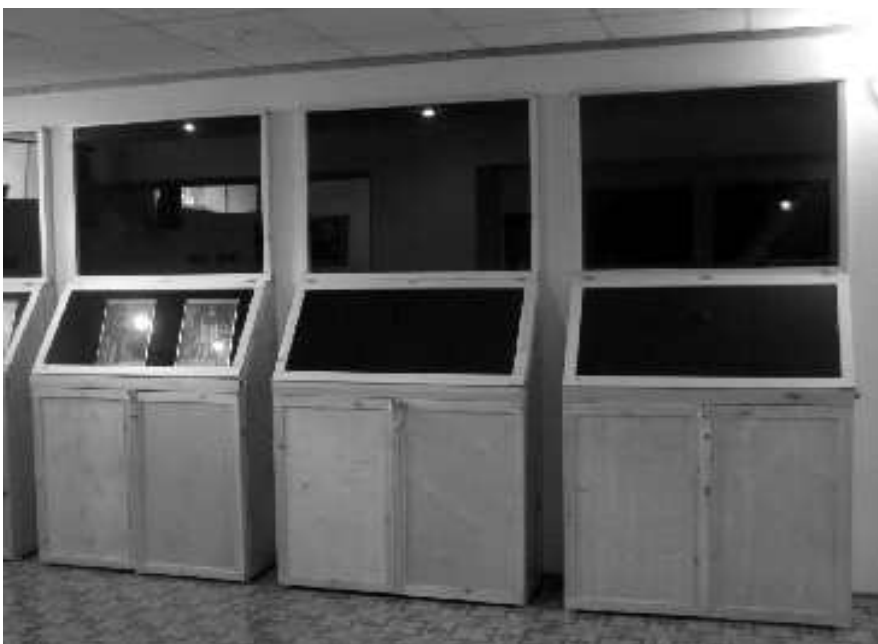
Подготовка помещения для музея при нашем храме

Желающим принять участие в работе музея или передать на хранение старинные вещи и материалы можно звонить алтарнику нашего храма Дулеву Максиму Анатольевичу по телефону: 8 (985) 923-82-58.