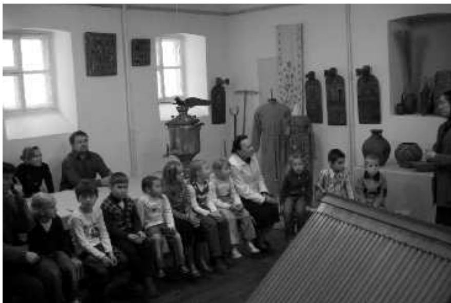
Музей храма Воскресения Христова в Кадашах