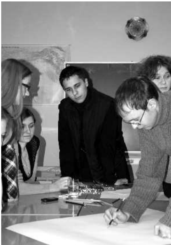
Молодежная встреча в Николо-Угрешском монастыре

– Я слышал не один раз такое мнение. Поскольку сейчас Святейший Патриарх ориентирован в своей проповеди и служении на молодежь, некоторые люди считают, что Церковь забывает о пожилых людях. Может быть, Вы как-то