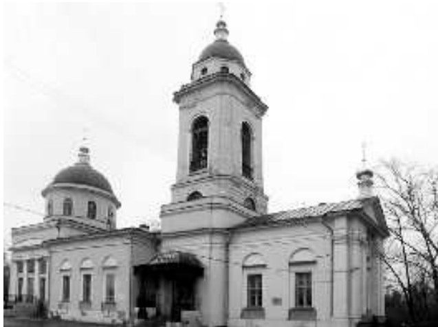
Скорбященский храм на Калитниковском кладбище