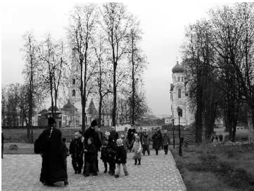
Воскресная школа нашего храма в Николо-Угрешском монастыре, 2005 год

В настоящее время работа с молодежью идет у нас в разнообразных направлениях. Направление, которым