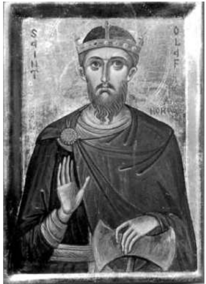
Святой Олаф Норвежский

Святому Олафу для объединения страны приходилось воевать. И в одном из таких боев он погиб от превосходящего силой противника. Мощи святого Олафа пребывали тогда еще в небольшом соборе