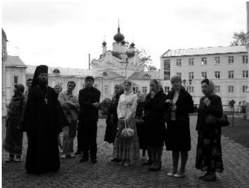
Экскурсия по Николю-Угрешскому монастырю

оказывается отчужденной от духовной культуры, и средства общения, и стиль одежды, и поведение часто прямо противоположны стилю жизни людей, находящихся в церковной среде. Поэтому для меня наиболее сложным моментом было вот это общение, и я сомневался, что мое обращение к ребятам достигнет своих результатов или хотя бы просто их заинтересует. Когда мы стали собирать молодежь, старшеклассников из простых школ, я понял что это не так, что есть потребность у школьников и студентов в духовной пище, есть и интерес к живому слову о вере. Самое главное то, что именно здесь, в Церкви, они смогут получить хорошие, положительные эмоции, почерпнуть какую-то уверенность в том, что их в Церкви любят и отнесутся к ним не формально, а с добротой и вниманием. Если мы, люди Церкви, стремимся уделить внимание, отдать часть своего сердца и теплоты молодым людям, которые, может быть, чужды нашей духовной традиции и в настоящий момент далеки от Церкви, то молодежь отвечает на это с благодарностью, а кто-нибудь, если не большинство, обязательно время от времени станет заглядывать в храм. Вот что я ощутил в ходе тех встреч, которые мы начали проводить.