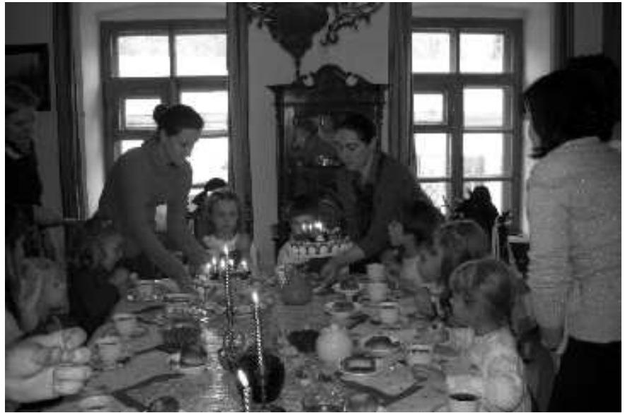
Детский праздник в музее