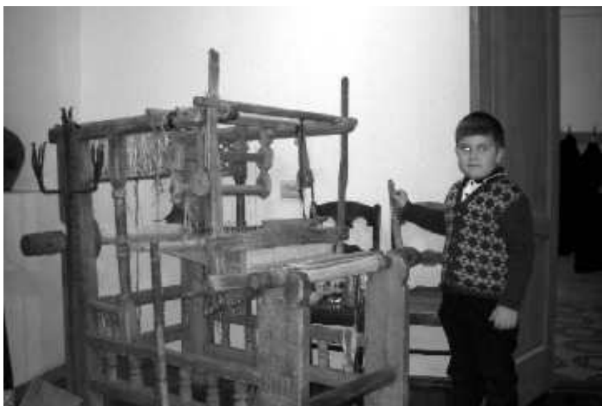
Старинный экспонат музея

Есть и другая проблема. Наша жизнь претерпела за последние годы значительные изменения. На смену книге пришел компьютер, телевизор и интернет. Потoki информации сменяют друг друга и не оставляют человеку возможности побыть наедине с самим собой. Мы привыкли постоянно находиться в режиме приема ненужной для нас информации. Её обилие порождает внутри хаос. Мы разучились думать и анализировать. У нас на это просто не хватает времени. Некоторые ученые считают, что современный человек уже практически не воспринимает информацию без