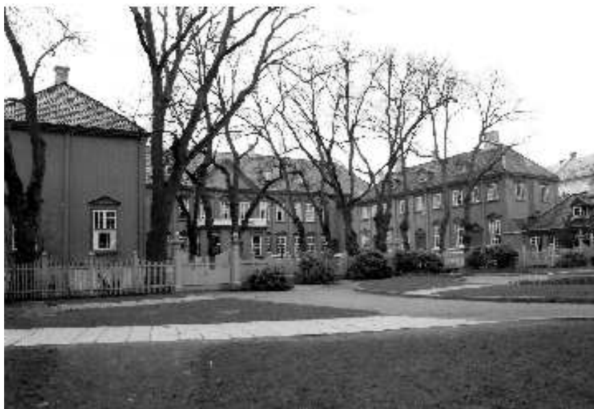
Королевская резиденция. Город Тронхейм

Осло. Утро. Я сажусь в поезд, который через восемь с половиной часов доставит меня на расстояние почти в 900 километров от столицы Норвежского Королевства в город Тронхейм. Город