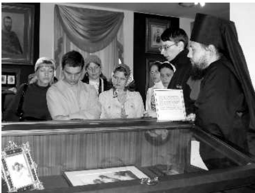
В музее Николю-Угрешского монастыря