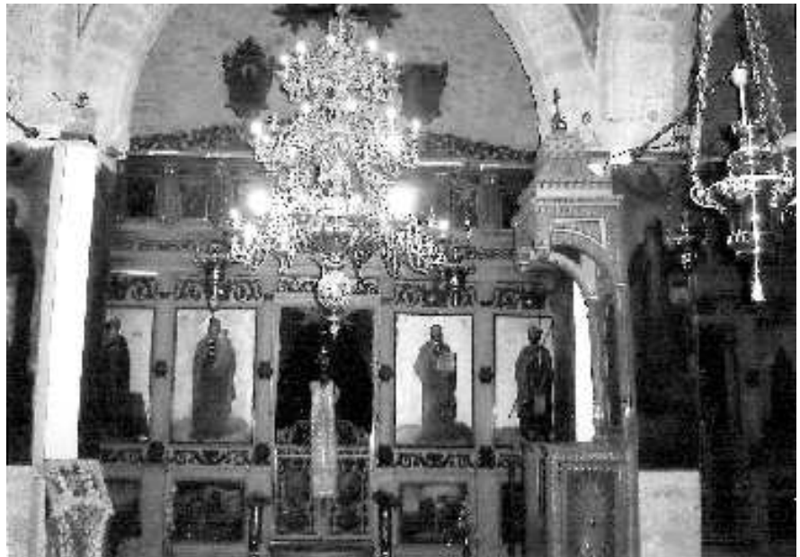
Монастырь прп. Герасима Иорданского

Сорокадневная Гора. Монастырь Искушений. Его сооружения вытянулись горизонтальной цепочкой по середине горы. От фуникулера поднимаемся горной тропой по выбитым в скале широким и пологим ступеням. Узкие коридоры монастыря защищают пещеры – кельи монахов, от палящего солнца. Из храма Искушения лестница ведет в часовню, в которой хранится камень, – на нем Господь молился и был иску-