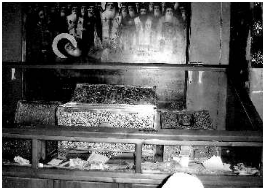
Икона погребения прп. Георгия Хозевита и ковчеги с мощами

С балкона открывается вид на пещеры-кельи отшельников, на кресты, установленные на вершинах гор, на древние, до сих пор действующие желоба, по которым собирают дождевую воду в резервуары. В храме большая икона погребения прп. Георгия Хозевита, простого монаха, на проводы которого прибыло множество иерархов. Под иконой ковчеги с мощами основателя монастыря, прп. Иоанна, прп. Георгия и частица главы Иоанна Крестителя. В соседней пещере нетленные мощи прп. Иоаннурумына, кожа на его руках и ногах сохранилась. Выше по лестнице церковь Божией Матери, расписанная русскими монахами с