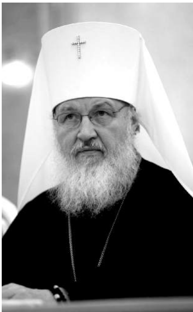
Митрополит Смоленский и Калининградский Кирилл