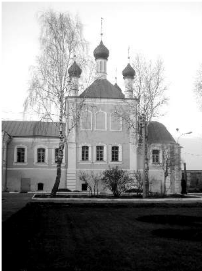
Храм Благовещения Пресвятой Богородицы в Никольском женском монастыре