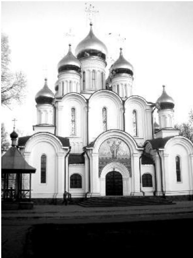
Собор свт. Николая в Никольском женском монастыре

В начале XIV столетия Переславское княжество вошло в состав Московского. Дальнейшая судьба Переславля тесно связана с судьбой Москвы. Переславцы любят при случае напомнить жителям других городов старинную поговорку: «Переславль-городок – Москвы уголок». В годы расцвета Переславль-Залесский ограждали колокольным звоном 14 монастырей и множество церквей. Сегодня четыре древнейшие святые обители вновь возносят ко Господу свои молитвы – это Никольский монастырь, Свято-Троицкий Данилов монастырь, Фёдоровский монастырь и Никитский монастырь.