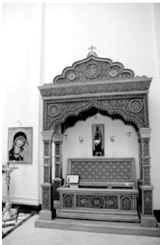
Рака с мощами св. князя Андрея Смоленского

Приходской листок Патриаршего подворья храма святителя Николая Мирликийского у Соломенной сторожки. Выходит один раз в месяц. Тираж 900 экз. Подписано в печать 25.03.09. Отпечатано в типографии «Вектор». Распространяется бесплатно. © Храм святителя Николая Мирликийского у Соломенной сторожки