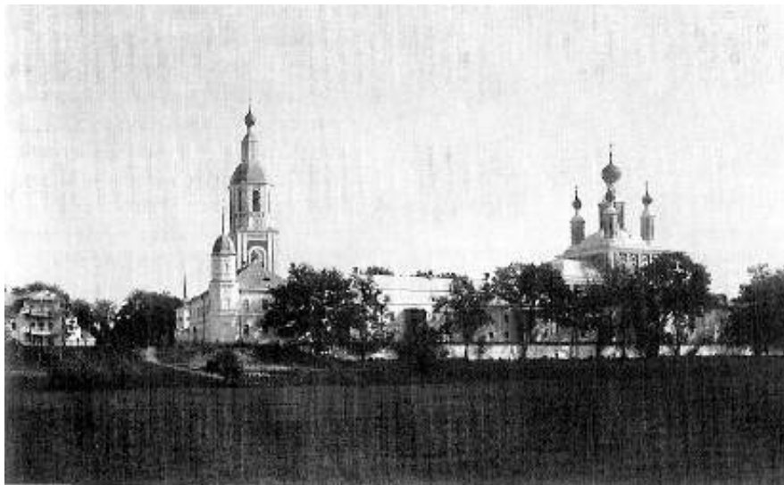
Рождество-Богородичный Санаксарский монастырь. Фото 1910-х годов

Воронеж, к святителю Митрофану. Потом направились в Ахтынский женский монастырь и прочие монастыри. Так дошли до Киева к преподобным Антонию и Феодосию Печерским, здесь на богомолье пробыли три недели. Из Киева обратно пошли на Чернигов к святителю Феодосию Черниговскому».