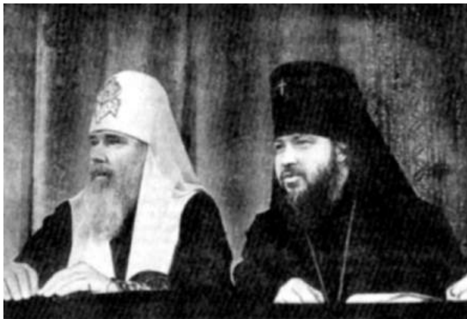
Патриарх Алексей II и новоназначенный Председатель ОВЦС МП архиепископ Кирилл

Удостоен орденов Александрийской, Антиохийской, Иерусалим-