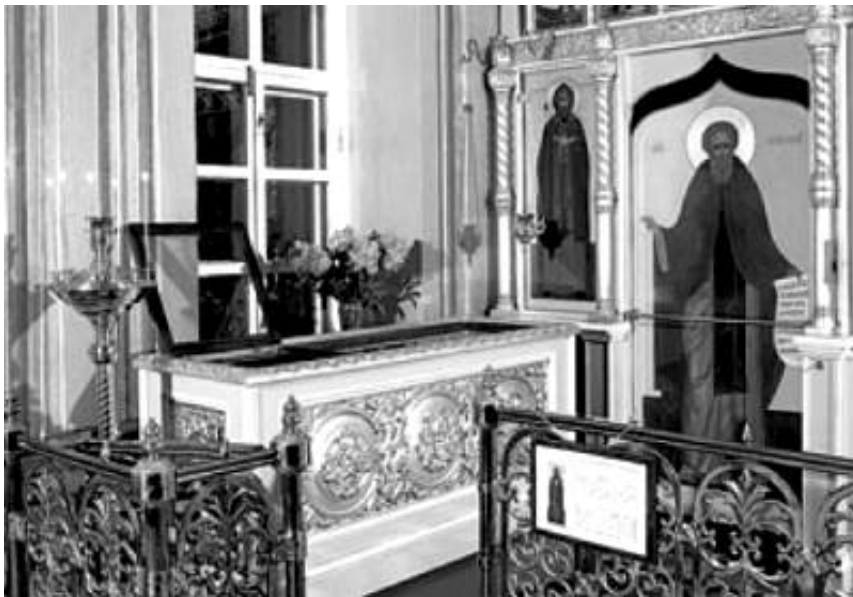
Рака с мощами прп. Корнилия Молчальника