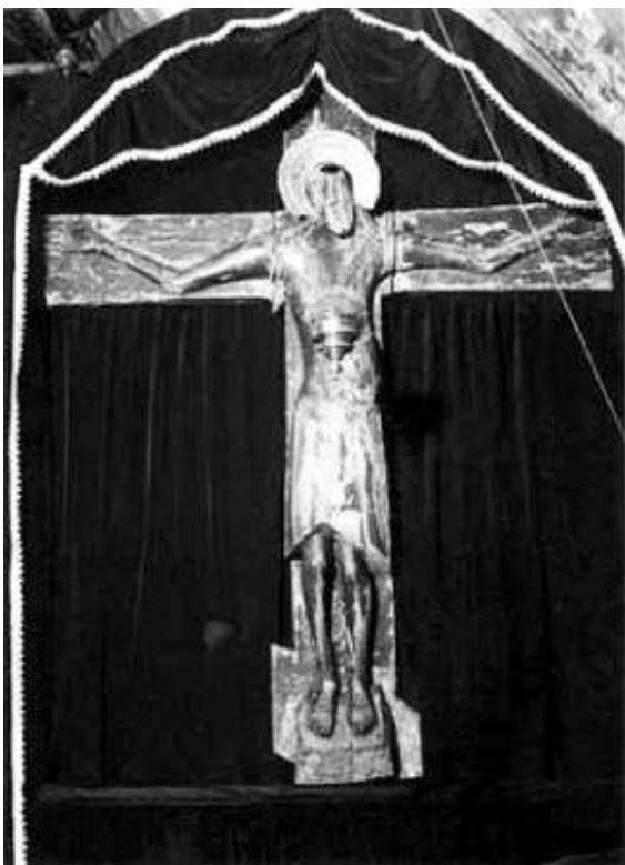
Животворящий Крест Господень