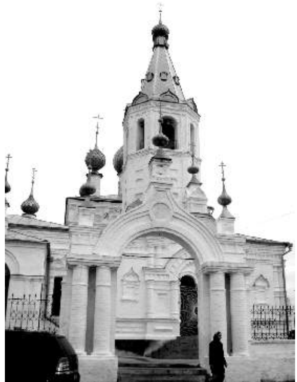
Храм святителя Иоанна Златоуста, с. Годеново

Переславль-Залесский – один из древнейших городов Центральной России. С его именем связаны взлеты и падения русской истории. Это город благоверного князя Александра Невского, Ивана Грозного и юного Петра. Город основан князем Юрием Долгоруким в 1152 году. На протяжении ряда лет Переславль был столицей обширного княжества. Здесь родился, жил и княжил выдающийся государственный деятель и полководец святой Александр Невский. Сохранился храм, где его крестили. На Красной площади Переславля-Залесского стоит этот храм и памятник доблестному воину и молитвеннику земли русской.