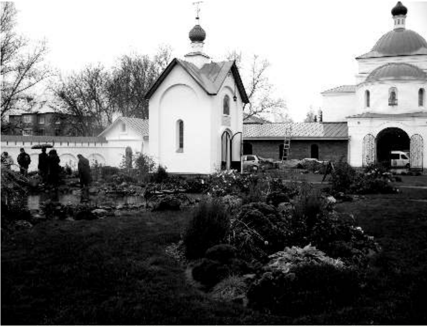
Часовня вмч. Георгия Победоносца и надвратная церковь прп. Кирилла Белозерского

выделены средства на строительство Спасо-Преображенского собора. Он представляет собой одноэтажный холодный храм, увенчанный пятью куполами шлемовидной формы. Этот собор – единственный в Муроме дошедший до нашего времени почти в первоизданном виде. Рядом со Спасо-Преображенским собором расположена церковь Покрова Богородицы, построенная в 1691 году, на первом ее этаже располагались «хлебня, мукосейня, хлебодарня, поварня, пекарня да палаты», а второй этаж занимал храм, состоящий из пяти приделов. В 1757 году с западной стороны к нему была пристроена колокольня. В конце XVII века на территории обители появляется новое здание – двухэтажные палаты настоятеля. Это старейший образец гражданской архитектуры Мурома. В настоятельском корпусе устроена домашняя церковь в честь святителя Василия Рязанского, бывшего некогда епископом Муромским и Рязанским.