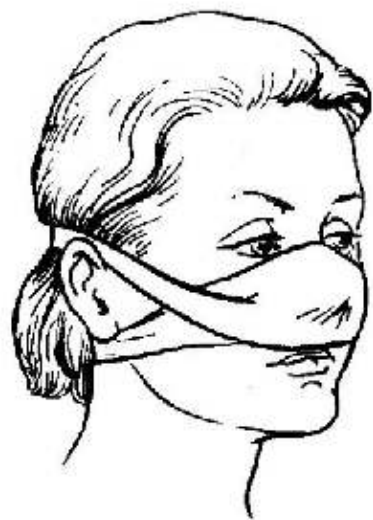
Рис. 1. Пратцевидная повязка

Характеризуется быстрым выбрасыванием крови ярко-красного цвета при травмах, чаще всего конечностей. При этом поражается центральная часть стенки кровеносного сосуда, оно может быть более или менее