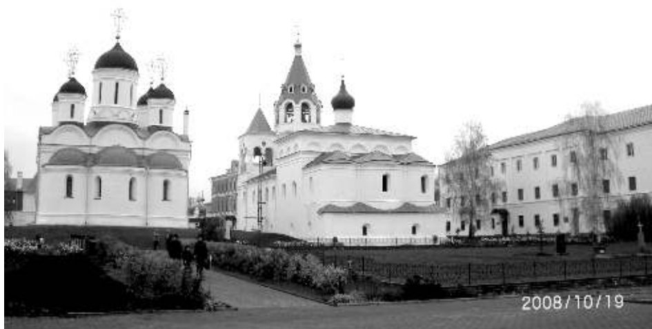
Спасский мужской монастырь. Спасо-Преображенский собор и церковь Покрова Пресвятой Богородицы

Спасский монастырь на страницах летописи вновь появляется в эпоху Ивана IV Грозного. После взятия Казани в середине XVI века царем были