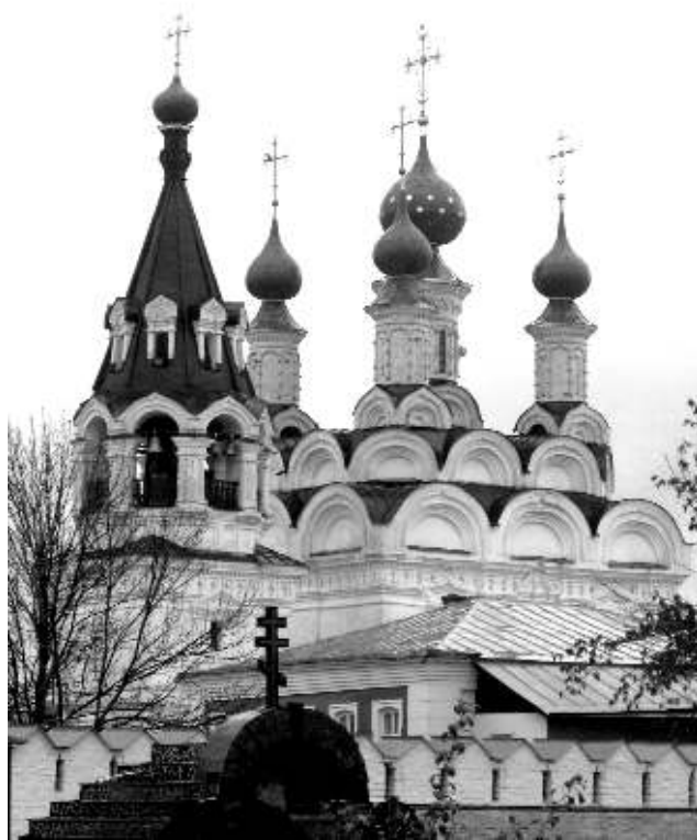
Благовещенский мужской монастырь. Благовещенский собор

еще долго хранила веру предков – до конца XI века. Двор крещеного во Христе князя Константина не мог долго мирно соседствовать с язычниками, в результате чего созрел заговор, и однажды ночью убийцы подкрались к дверям княжеских палат, чтобы расправиться с Константином. Князь вышел им навстречу безоружный, держа в руках лишь икону Муромской Божией Матери. Икона просияла, и злоумышленники пали ниц пред ликом Богородицы и просили