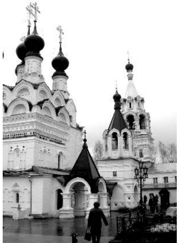
Свято-Троицкий монастырь. Троицкий храм и надвратная Казанская церковь

В Троицкий монастырь мы стремились чтобы поклониться мощам святых благоверных князей Петра и Февронии – покровителям любви и благополучия в браке. Удивительна история любви и супружества юного князя и дочери рязанского бортника! Помолвившись у раки за всех моих близких, друзей и знакомых, испросила у святых покоя, понимания, любви, счастья и благополучия в семьях, а одиноким – найти свою «половинку», набрала святой воды из источника и пошла через дорогу, туда где расположился