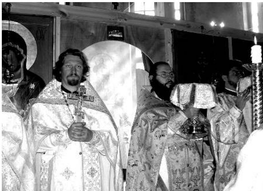
Первая Божественная литургия в храме свт. Иннокентия, митрополита Московского, в Бескудникове, 15 сентября 2005 года