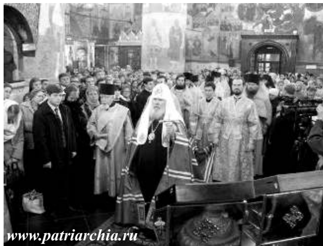
Литургия в Успенском соборе Московского Кремля

начал свой монашеский подвиг прп. Сергий. Затем в Покровском монастыре Хотькова поклонились святым мощам родителей игумена Земли Русской преподобных Кирилла и Марии. На обратном пути воспитанники Воскресной школы побывали в Черниговском скиту Лавры, на месте подвигов прп. Варнавы Гефсиманского.