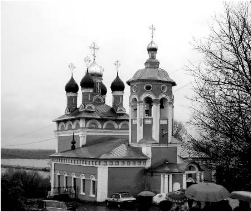
Церковь Николая Набережного