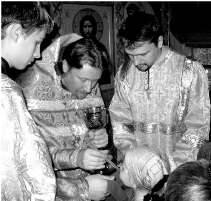
Литургия в храме святителя благоверного князя Димитрия Донского для учеников Воскресной школы

– Что было самым трудным за восемь лет Вашей настоятельской работы?