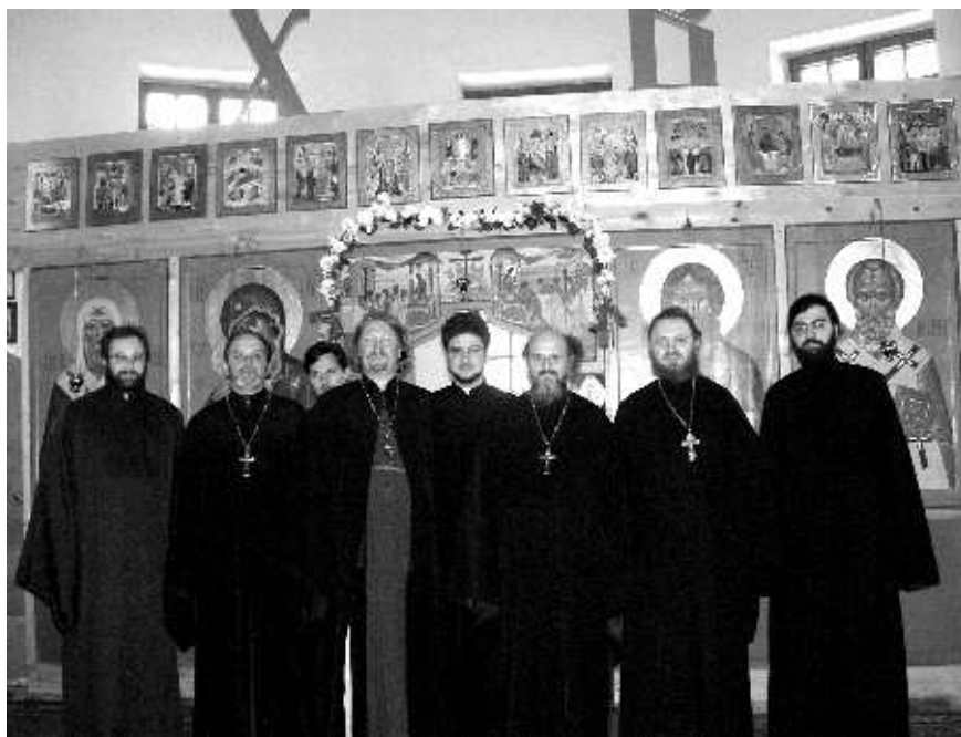
Престольный праздник храма. 13 апреля 2007 года

Как-то к нам приехали из Ростехнадзора. Работница вошла в наш ИТП и стала задавать вопросы. А я не технический человек и такие слова: вентиль, манометр – услышала от нее в первый раз. И тогда я подумала: «Все! Об этом же никто не говорил, значит, она нашла то, чего у нас нет». Нервы у меня, конечно, сдавали. Если она сейчас не подпишет, то все. И мы с ней выходим, идем по нижнему храму, холодно, уже зима, воздух холодный, промерзший, кругом стройка, цемент. Мне что-то стало так горько, и я говорю: «Ну вот,