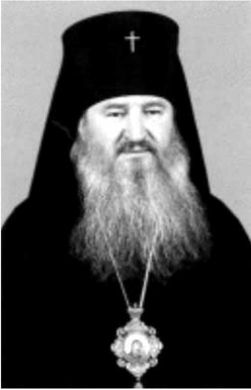
Архиепископ Ставропольский и Владикавказский Феофан

переговоров, в ходе которых уважались бы традиции, взгляды и чаяния грузинского и осетинского народов.