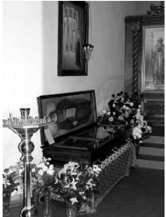
Рака с мощами преподобного Александра Свирского в Преображенском храме