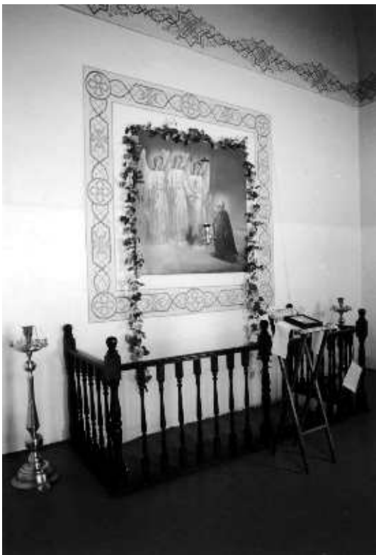
В часовне построенной на месте явления Святой Троицы

Святой преподобный отче Александре, моли Бога о нас!