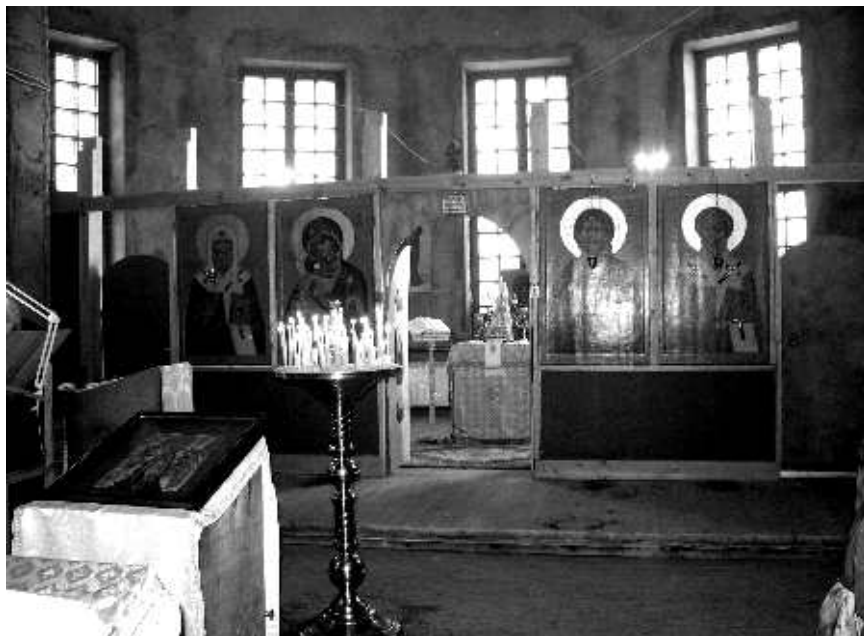
Крещение Господне. 2006 год

благодарного князя Даниила Московского. Подарили нам и надвратную икону Спасителя. Потомками святителя Иннокентия нам в храм была передана главная святыня – икона Ситской (Казанской) Божией Матери с частицей св. мощей свт. Иннокентия Московского, которую нам привезли из Америки из города Ситка. Для нее на пожертвования прихожан заказан красивый напольный киот.