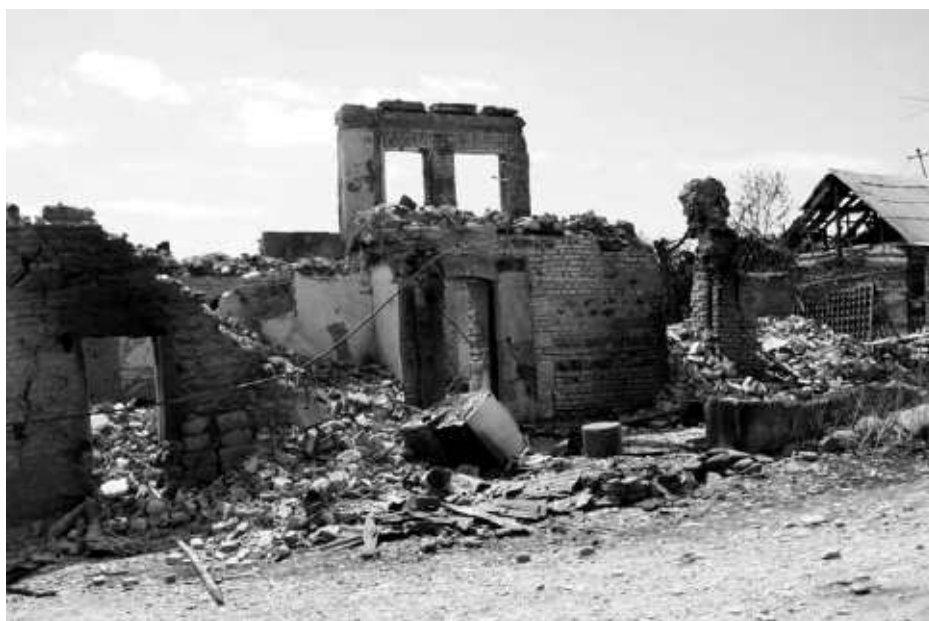
Разрушенная столица Южной Осетии Цхинвали

Знаю о призыве к миру, сделанном Святейшим Католикосом-Патриархом всея Грузии Илией II. Обращаю к тем, кто сегодня ослеплен враждой, и свой горячий призыв: остановитесь! Не дайте пролиться еще большей кровью, не позвольте многократно расширить сегодняшний конфликт! Проявите мудрость и смелость: сядьте за стол