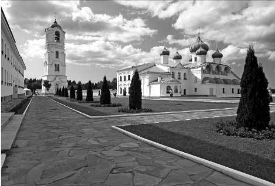
Александрo-Свирский монастырь. Колокольня и Преображенский храм

запомнила) и завел с нами разговор. Сначала это только немного удивило, ведь в таких коротких поездках (ехать всего ночь) люди обычно не склонны к общению. А потом атмосфера в купе стала буквально накаляться, так как наш попутчик ни с того ни с сего начал произносить хулы на святую Церковь, ее служителей, святых. Меня обьял ужас. Вначале я пыталась возражать, увещевать мужчину, но видя, что попытки тщетны и только раздражают его, замолчала. Муж властно прервал попутчика, и тот наконец прекратил свой жуткий монолог. А я еще долго ворочалась на своей полке, пытаясь понять, что могло спровоцировать такую реакцию: ведь в нас ничего не выдавало православных паломников (крестики, как и положено, под одеждой, я без платочка, муж тоже одет обычно). Позднее мне рассказали случай, когда на паломников, возвращавшихся из Оптиной пустыни, в метро напала женщина и стала их бить по лицу. Бывает и такое.