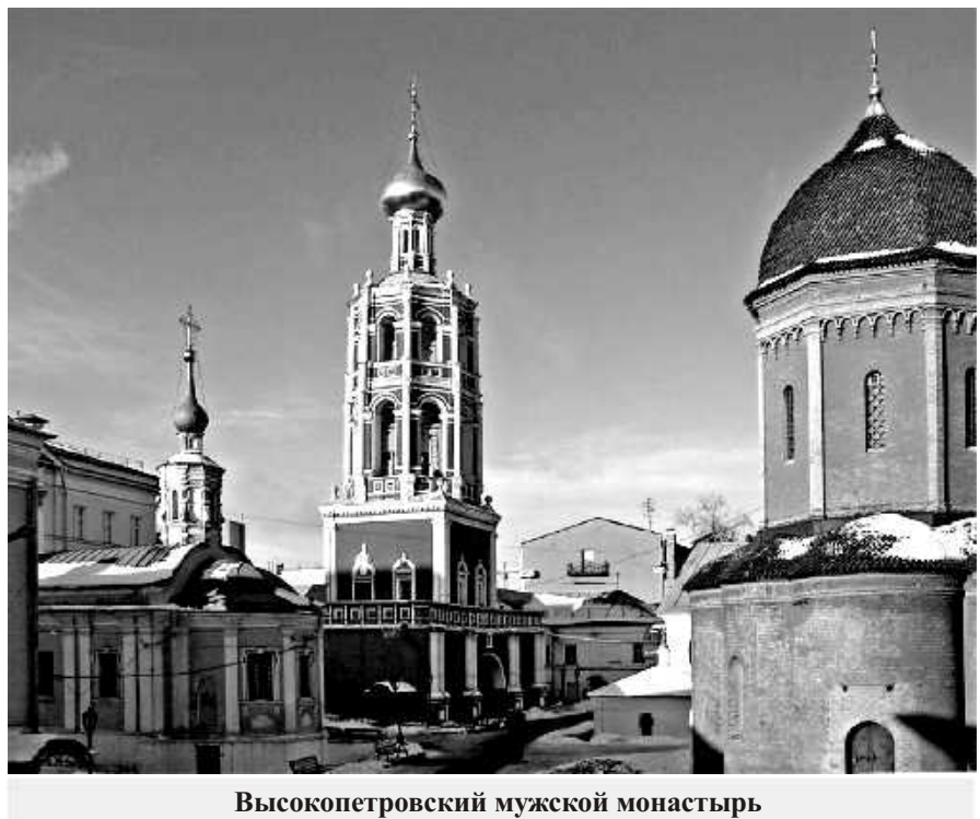
Высокопетровский мужской монастырь