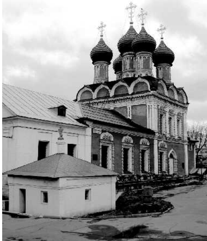
Церковь во имя иконы Божией Матери Боголюбской и часовня-усыпальница бояр Нарышкиных

В часовне-усыпальнице бояр Нарышкиных выставка картин, некоторые наши дети с родителями посетили ее, на обозрение выставлены надгробья из усыпальницы. Собор свт. Петра, митрополита Московского, был