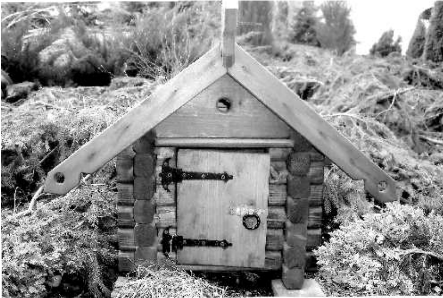
Декоративный домик на территории Сретенского монастыря

подошел семинарист и, извинившись, предложил осмотреть сначала территорию монастыря, библиотеку семинарии, а затем уже и храм. Так и сделали.