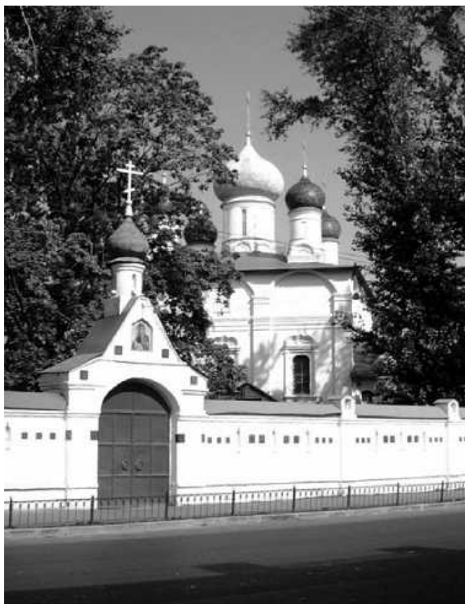
Сретенский мужской монастырь

Поражают тишина, уют, чистота, ухоженность территории, а также, как и во всех монастырях, ощущение нахождения вне времени и пространства. Ловлю себя на мысли: «А в Москве ли мы? Ведь это центр мегаполиса!» А здесь, за невысокими стенами монастыря, умиротворение, покой, неторопливое течение дня.