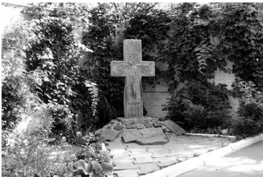
Поклонный крест на территории Сретенского монастыря