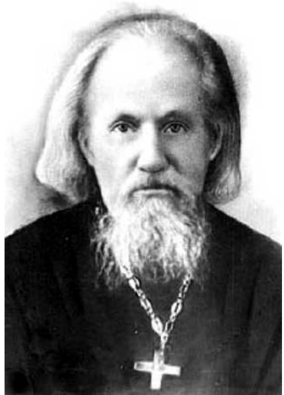
Преподобный Леонтий Михайловский