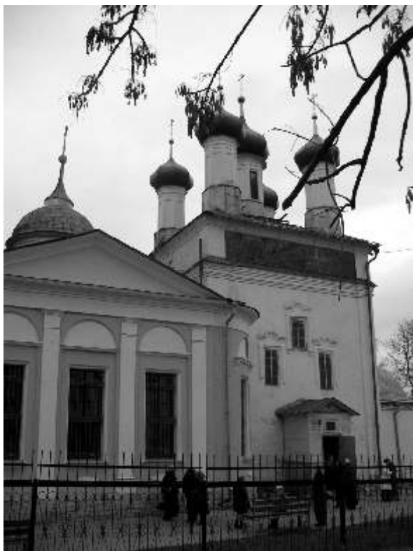
Благовещенский кафедральный собор г. Боровска

бодив помещение совсем недавно. К сожалению, сие перемещение сопровождалось и «переездом» ряда ценных исторических предметов, принадлежавших ранее монастырю. Это старое издание Евангелия и Потир, из которого причащался и причащал преподобный Пафнутий. Музей отказывается возвращать эти «экспонаты». Монастырь был передан Православной Церкви и вновь открыт в марте 1991 года. Постепенно к монастырю перешла большая часть строений, монастырский сад с заросшими прудами.