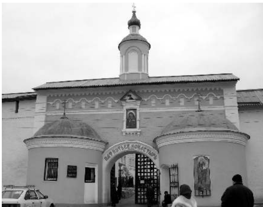
Святые врата в Рождества Богородицы Свято-Пафнутиев Боровский монастырь

В течение 33 лет преподобный Пафнутий обустроивал монастырь. Он собрал вокруг себя 95 человек братии. Это было самое большое количество монахов за всю историю монастыря. Насельниками монастыря при жизни преподобного Пафнутия были выдающиеся подвижники, деятели Церкви и Государства: преподобный Давид Серпуховской, преподобный Иосиф Волоцкий, преподобный Даниил Переяславский – крестный отец Ивана Грозного. Здесь жил и работал величайший иконописец XV в. Дионисий.