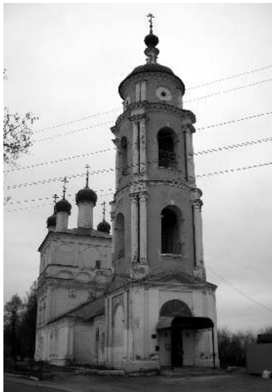
Храм свв. князей Бориса и Глеба в г. Боровске

Далее наш путь лежал в Малоярославец, в Свято-Николаевский Черноостровский женский монастырь. Какие труды по его