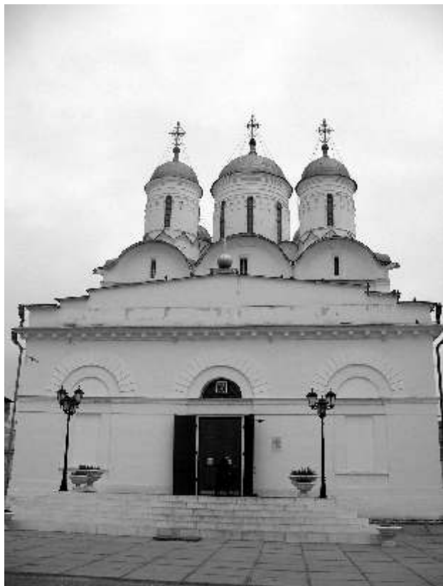
Собор Рождества Пресвятой Богородицы в Свято-Пафнутьевом Боровском монастыре

Воскресения, когда не нашли и за большие деньги священника, совершил Литургию со многим вниманием и умилением. «Ныне едва душа моя осталась во мне», – говорил он по совершении ее своим ученикам.