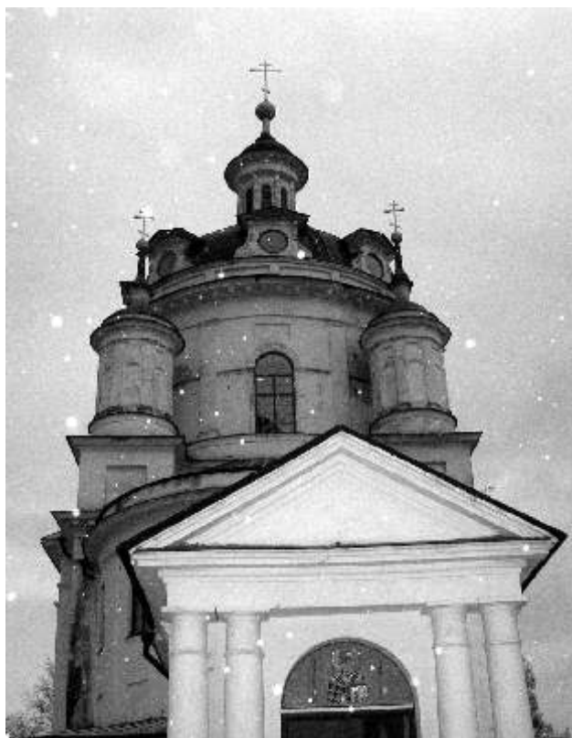
Собор святителя Николая Чудотворца в Свято-Николаевском Черноостровском монастыре

Дорога обратно не была утомительной. Энергичное повествование нашего экскурсовода сменил просмотр фильмов о схиигу-