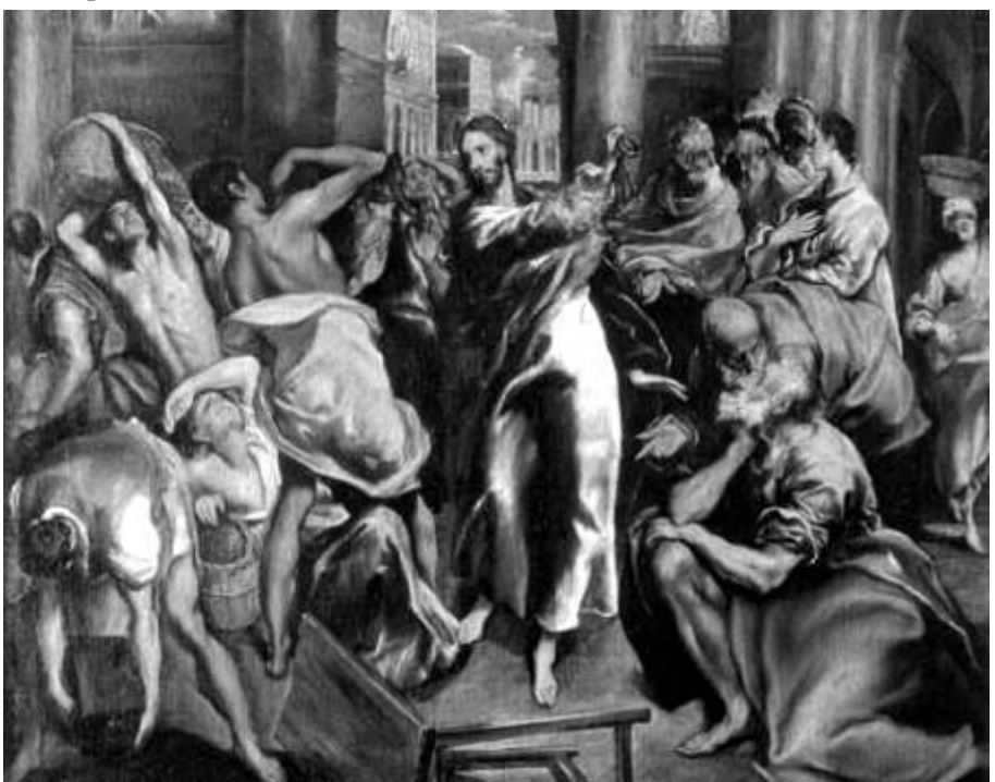
Эль Греко. Христос изгоняет торговцев из храма

Во-первых, это совсем не торговля. Когда мы приобретаем что-то в храме, мы жертвуем, вносим свою лепту на храм. В храме, например, не продаются канцелярские товары или еще какие-то вещи, не связанные с богослужением. У нас за свечным ящиком имеются только те предметы, которые нужны для молитвы, службы, участия в Таинствах.