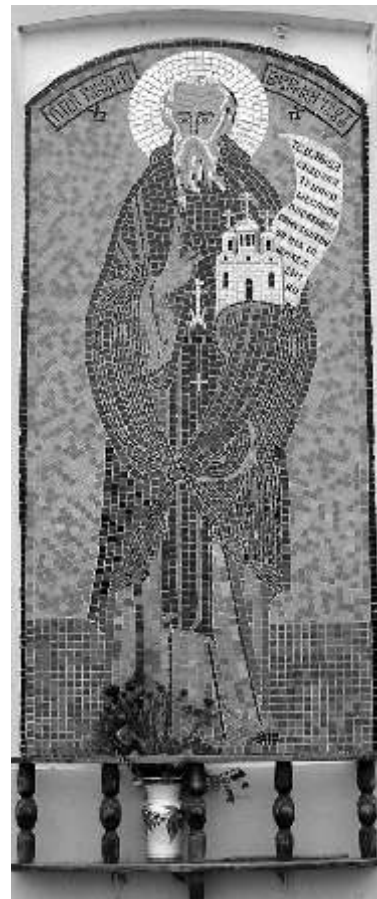
Образ преподобного Пафнутия Боровского

Рождества Богородицы Свято-Пафнутиев Боровский монастырь был основан в 1444 году преподобным Пафнутием Боровским, духовным внуком преподобного Сергия Радонежского. По свидетельству современников, преподобный Пафнутий во всем избегал неумеренности, всегда старался избегать праздности, любил нищету и скудность.