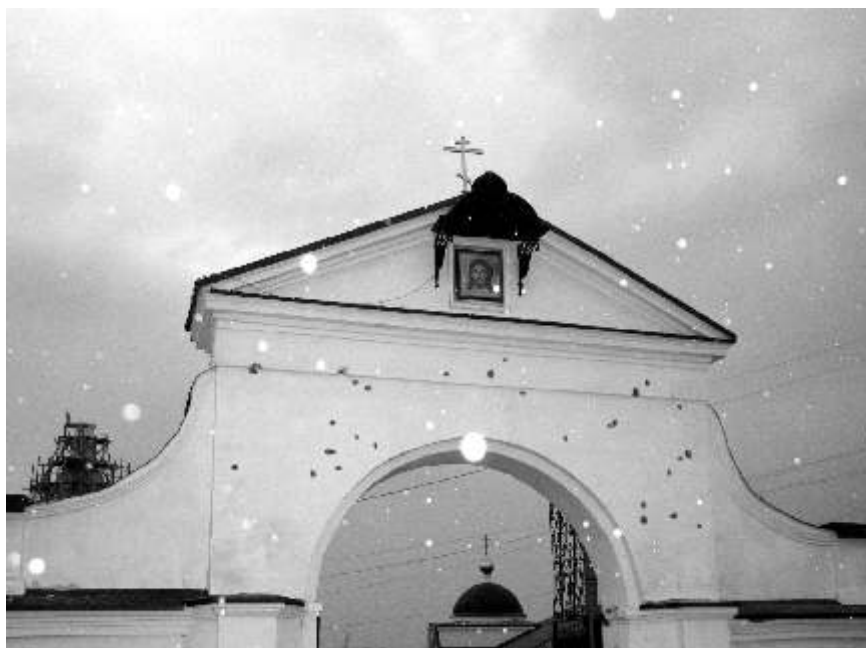
Врата Свято-Николаевского Черноостровского монастыря со следами пуль от французских орудий