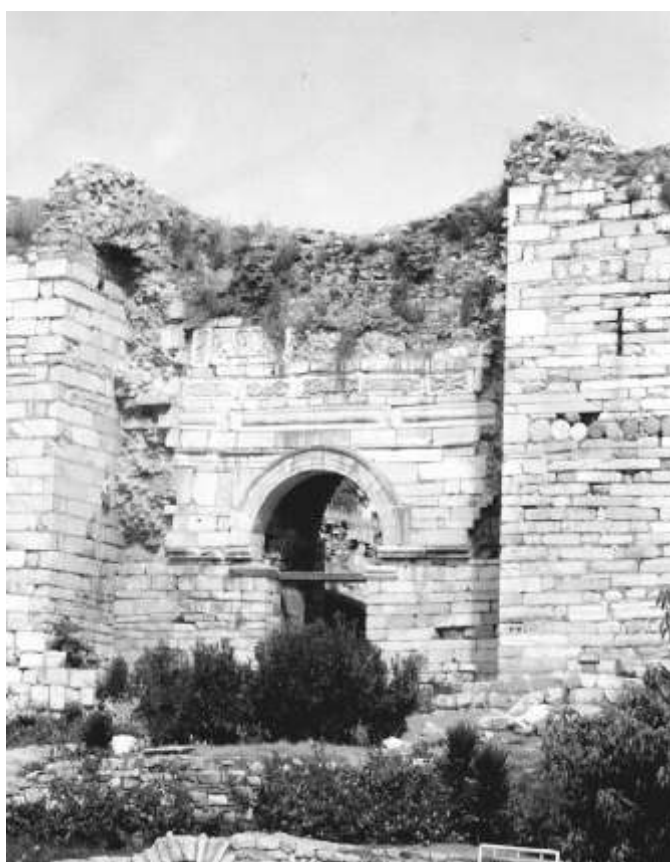
Храм апостола Иоанна Богослова

щало то, что именно оттуда гид предлагал посмотреть на храм апостола Иоанна, видневшийся вдали на холме. Мы снова стали приставать к гиду с вопросом: почему не предусмотрено посещение такой святыни? Он дал нам исчерпывающий ответ: «За те 6 лет, что я работаю гидом, я впервые от вас слышу такую просьбу». На что мы уверенно сказали ему, что таких людей будет все больше и больше (и уже сейчас существуют православные