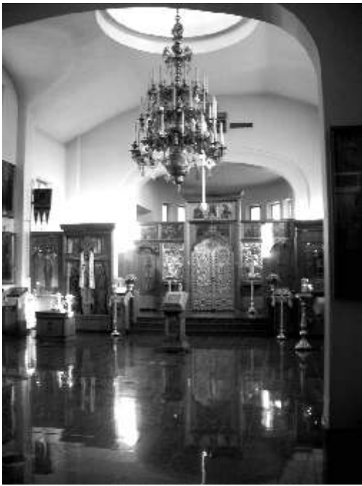
Интерьер Преображенского собора

России. Не было ни ограды, ни монастырских врат, а лишь небольшой белокаменный собор в окружении невысоких красивых домиков на глади аккуратно стриженного газона. В один из этих домиков мы прошли для того, чтобы зарегистрироваться и получить ключи от гостиничных комнат. Тут же, помимо администратора, располагается монастырская лавка, в которой можно купить не только церковную литературу и утварь, но также и монастырские чай, соленья и знаменитое Ново-Валаамское ягодное вино из смородины и морошки.