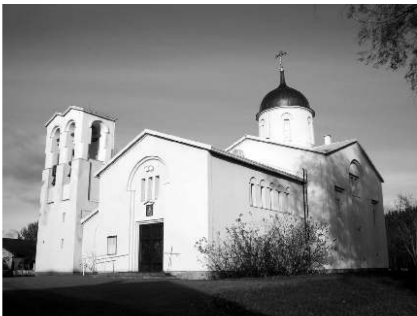
Собор Преображения Господня

амом отошло к территории Советского Союза. Величественный древний монастырь был превращен в руины советскими бомбежками, а его духовная жизнь перенеслась вглубь Финляндии. Место для нового монастыря было выбрано не случайно. Именно в Хейнявеси в одном из предложенных для монастыря домов братия обнаружила небольшую икону прпп. Сергия и Германа Валаамских. Это было воспринято как указание Божие. А потому именно в этом месте и поселилась многочисленная (около 200 мона-