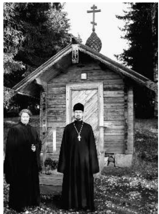
Часовня свт. Николая на берегу озера

Уезжать из монастыря не хотелось. Хотелось подольше задержаться на этом небольшом, но сильном духом, островке Православия на севере Западной Европы, столь богатом святынями. Мне кажется, эта обитель с истинно монашеской жизнью – ясное свидетельство того, что Православие не ограничивается ни странами, ни народами. И что нам, православным в России, имеющим множество святынь, храмов и монастырей, но порой не ценящим всего этого, есть чему поучиться у наших православных соседей в Финляндии.