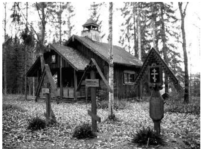
Часовня прп. Германа Аляскинского

После красивого долгого заката наступили столь же долгие северные сумерки. Заметно подморозило. Воздух стал еще свежее и чище. На темнеющем небе стали загораться первые звездочки. Мы поспешили на вечернее богослужение. В соборе было почти темно. По стенам, увешанным старинными Валаамскими образами, струился мягкий свет свечей и лампад. На финском языке служил вечерню и утрению наместник монастыря архимандрит