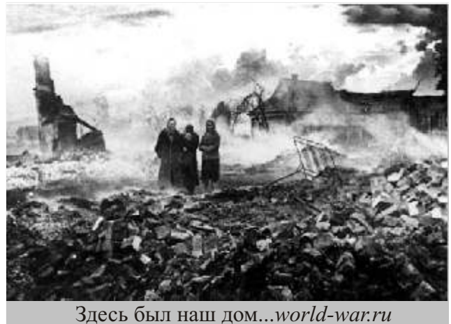
Здесь был наш дом...world-war.ru

Несомненно, 16 октября Москва была подготовлена к сдаче. Из города были выведены все вооруженные силы. Населению раздавались продукты (так было и при подготовке к сдаче других городов). Такой вывод со временем подкреплялся рядом многих других свидетельств. Один мой коллега, состоявший в ополчении под Москвой и чудом уцелевший, рассказывал, что 16 октября пешком добрался до столицы и направился в военкомат сдать карабин. А там пусто, нигде никого. Что делать? Он решил обратиться к первому попавшемуся милиционеру и объяснить ситуацию. Но так