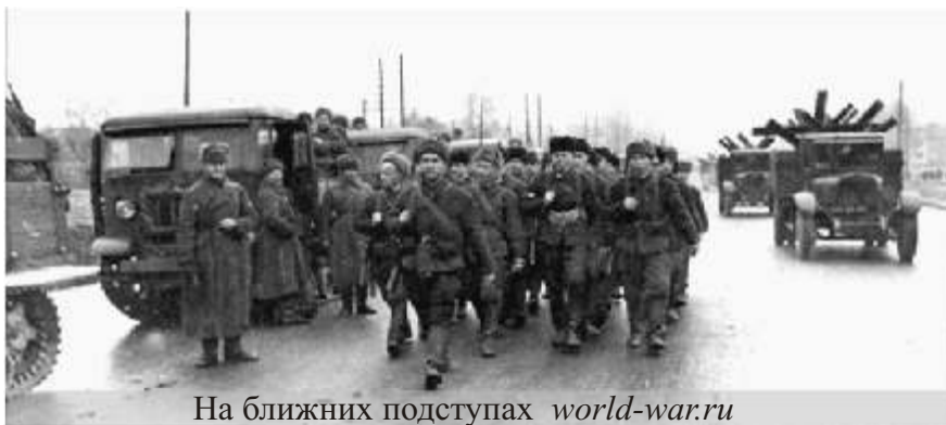
На ближних подступах

Незадолго до этого с оборонительных работ под Москвой вернулся домой наш родственник,