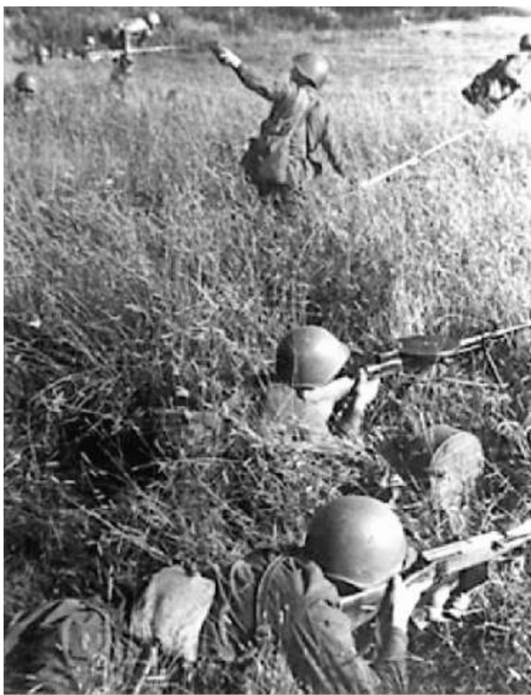
Стрелковое отделение в наступлении

Но спустя какое-то время о ней забыли. Действительно, все эти воины геройски погибли, защищая Москву. Так что же, Гудериан не посмел двинуть свою армию по трупам героев?! Говорили и теперь говорят о жестоких боях на других участках фронта. Но ведь с запада Москва была открыта, путь для немецких танков был свободен... Недоумение мое разрешилось