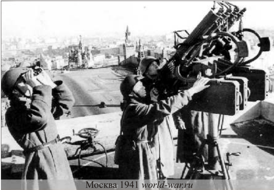
Москва 1941

измученный, грязный, с почерневшим лицом. «Скоро немцы придут. Все, все кончено» - вот его слова. Он рассказал, что видел издали немецкие танки, но, добираясь до города, не встретил не только ни одной нашей воинской части, но и даже постов заграждения. «Дорога для немцев открыта.»