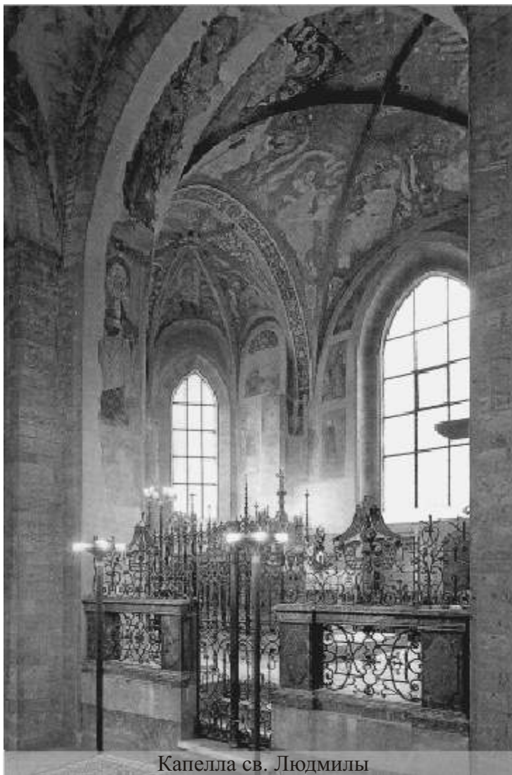
Капелла св. Людмилы

мы показали смотрителю. Он знаками показывает нам, что мы можем подойти. Благоговейно прикладываемся к гробнице, освещаем на ней купленные в соборе Кирилла и Мефодия иконы святой Людмилы. Все это длится несколько минут. Провожая нас, смотритель спрашивает: «Откуда вы?» – «Из Москвы», – отвечаем мы ему,