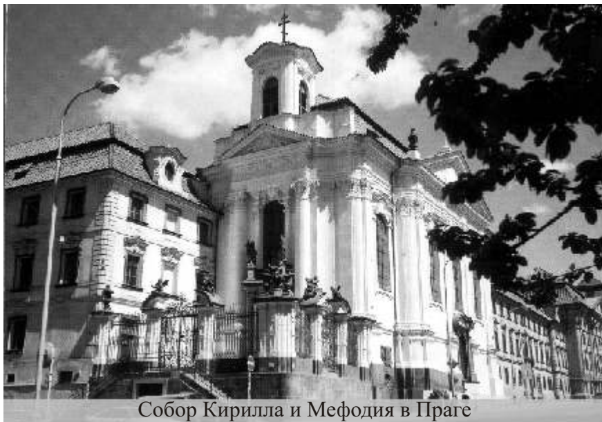
Собор Кирилла и Мефодия в Праге

Побывать в Чехии было моей давнишней мечтой. В те времена страна не была разделена на Чехию и Словакию, а я еще была «захожанкой» – приходила в храм только по большим праздникам – поставить свечку. С той поры прошло много лет, мы с мужем стали прихожанами нашего храма, а мечта посетить Чехию наполнилась духовным содержанием: очень захотелось побывать на родине святой Людмилы Чешской и поклониться ее святым мощам.