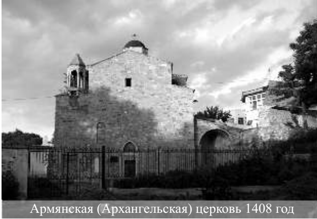
Армянская (Архангельская) церковь 1408 год