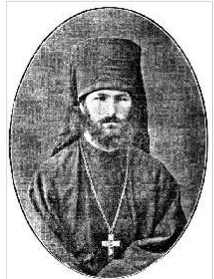
Иеромонах Владимир (Соколовский)

«Вот старушка в серой юбке поспешно раскатывает от кафедры к дверям храма длинный нарядный ковер. Из алтаря выходит духовенство. Под звуки трезвона, под неугомонный говор маленьких, средних и больших колоколов в храм входит владыка. Это знакомый всем престарелый архиепископ Владимир. Он тихо крестится, устремив глаза вверх толпы на алтарь. На нем синяя бархатная ряса и порыжелая скуфеечка с крестом из шести круглых красных камушков. Иподиаконы накидывают на его плечи черную мантию в серебристых стеклянных блестках. Тихо идет он при пении хора к царским вратам и там долго совершает молитву. Облачают его посередине храма на кафедре. К нему идет черное бархатное траурное облачение с серебряными крестами. Облачившись, он садится в резное деревянное кресло, вплотную пододвинутое к кафедре. Он слушает часы и начало обедни сидя на кресле. Иногда он встает и что-то шепчет, осеняя себя крестом... Он шепчет не то, что читает чтец, и не то, что поют. Слушая чтение псалмов и пение хора, он возносит молитву к Богу своими собственными словами... Он шептал «Царю Небесный» и «Трисвятое». Он шептал их не так, как их обычно читают в церкви, не поспешно, не наскоро, а чрезвы-