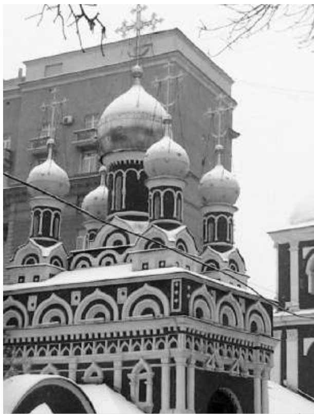
Храм Успения Пресвятой Богородицы в Гончарах