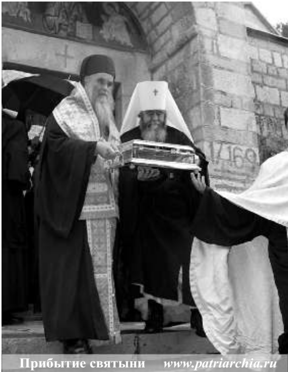
Прибытие святыни

3 июня – день престольного праздника в кадетском корпусе. Репортаж о празднике читайте в номере.