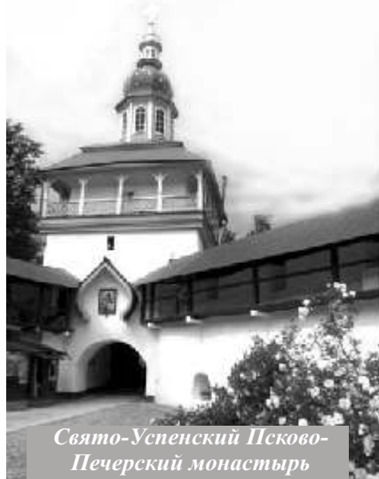
Свято-Успенский Псково-Печерский монастырь

бывает такое отношение: немедленно все подать! Вот и мы думали, что сейчас придем, отстоим службу – и о. Иоанн нас сразу примет, обогреет и все будет хорошо. Так не получилось. Батюшка Иоанн вышел после службы и сказал: «Ой, ребята, у меня для вас время будет. Не переживайте». И очень живенько побежал.